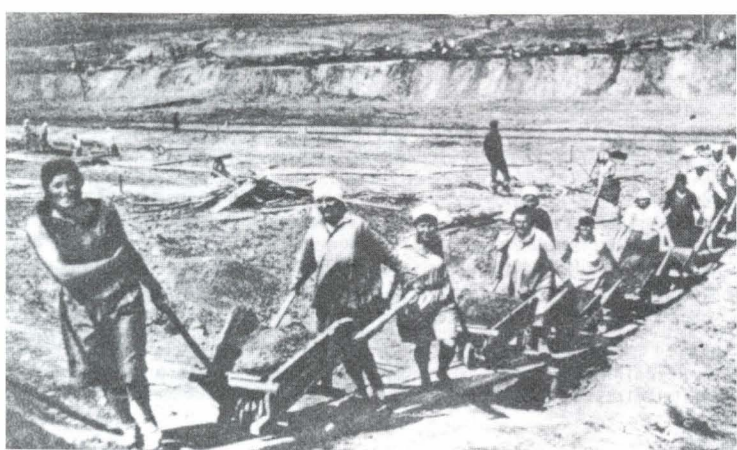
Vrouwelijke dwangarbeiders voeren in houten kruiwagens, met houten wielen, het losgebrosen graniet af tijdens de aanleg van het Witte-Zeekanaal.