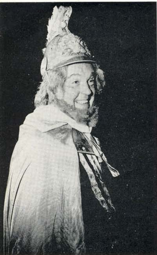
Voltreffer!! Met de glimlach van de overwinnaar aanschouwt deze dappere strijder (en bekend zeiler) de vuurzee in de Spaanse eskaders. De eeuwenoude kanonnen op het fort „Den Haak” van Veere hadden hun werk goed gedaan!

goed pasten onze ronde en platbodem-jachten in deze oude entourage! En zeker heeft deze gebeurtenis voor velen hier in Veere en in het gewest de ogen geopend voor wat hier bij een goed beleid op het gebied van de watersport bereikt kan worden behalve de druk bezochte Pinksterwedstrijden van de laatste jaren, die van zo'n geheel andere allure zijn en die zoveel meer een vreemd element vormen in deze historische omgeving.