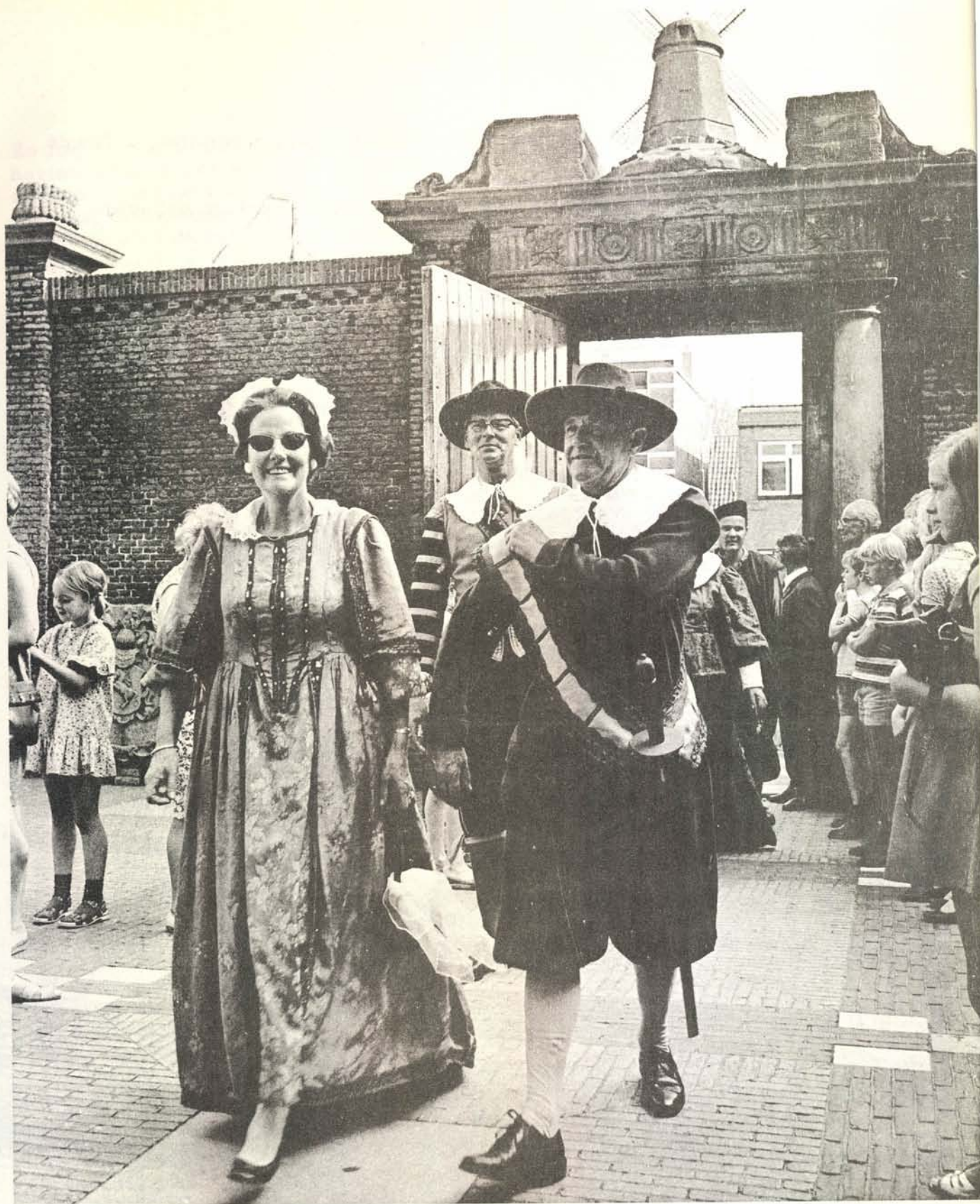
Heel wat meer voorspoed ondervond te tocht van de "Pilgrimfathers" van Leiden naar Delfshaven op 1 augustus van dit jaar. Ruim 50 schepen lagen de dag daarvoor in het centrum van Leiden, tegenover de Lakenhal, Stralend weer, alle schepen gepavoiseerd, ieder lid van de bemanning zonder uitzondering in 17e eeuwse kostuum en daarvan een aantal in het stemmige zwart van de Pilgrimfathers, dat het bijzonder goed deed. Het leek eigenlijk een soort kleine zomerreünie, daar in Leiden.