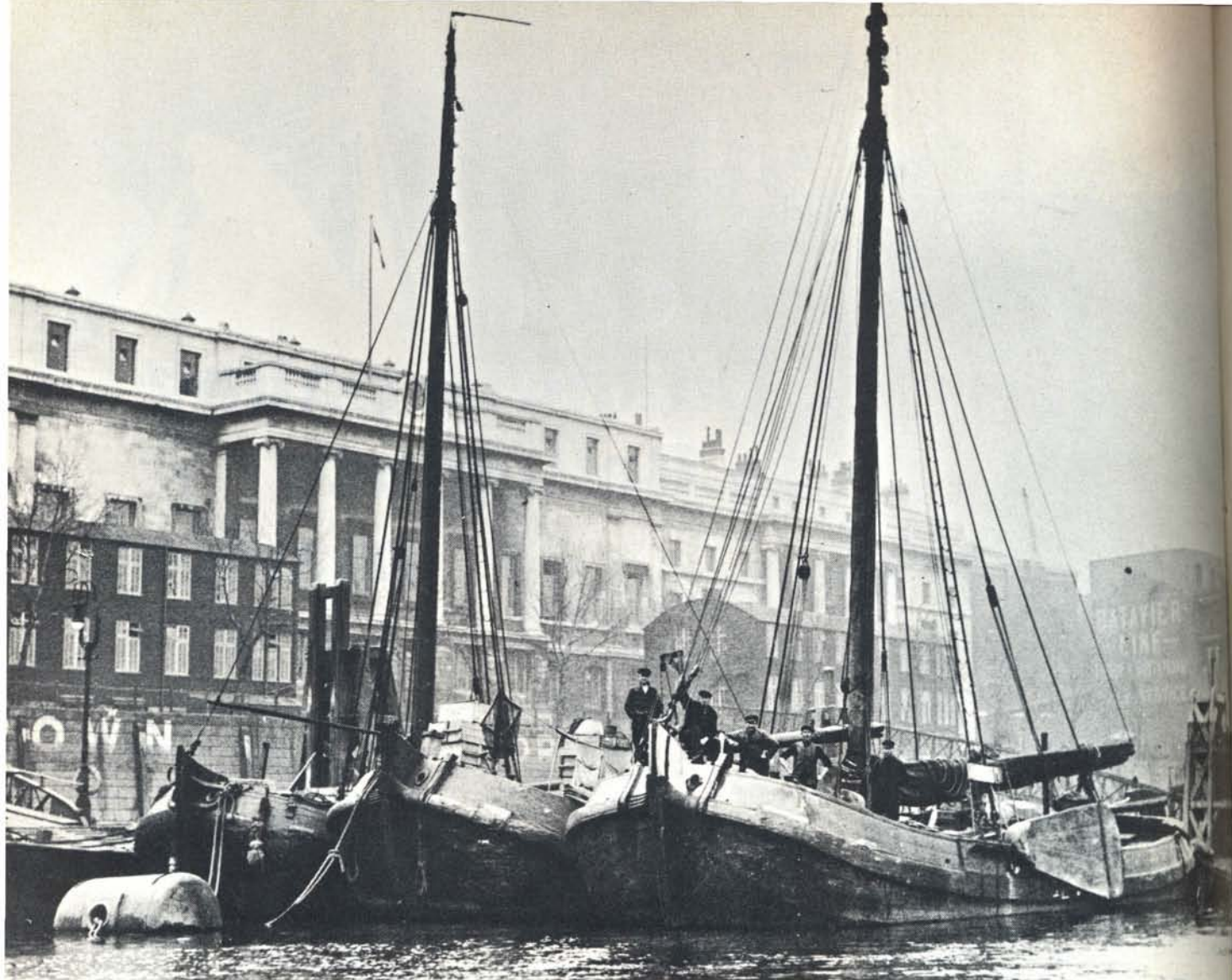
Friese palingaken gemeerd bij Bellingate, de grote vismarkt van Londen, in de eerste jaren dertig. De Friese palinghandelaars hadden in die jaren het privilege hier ter hoogte van de Towerbridge, ligplaats te kiezen. Deze winter kwam men op het idee nogmaals van het privilege gebruik te maken en met een aantal ronde en platbodemjachten een tocht naar Londen te maken. Enkele „palingvaarders anno 1970“ vertellen op deze pagina's iets van hun ervaringen.

volk” drupsgewijs binnen te lopen. Iedereen komt aan: de Botters, de Schouwen, de Hoogaarzen, de Tjalcken, de Schokker en de Hengsten. Goed, de Jonge Jozef maakt wat water en de Vrouwe Eliza kan het ook niet helemaal drooghouden, maar Ramsgate is tenslotte een stuk dichterbij gekomen.