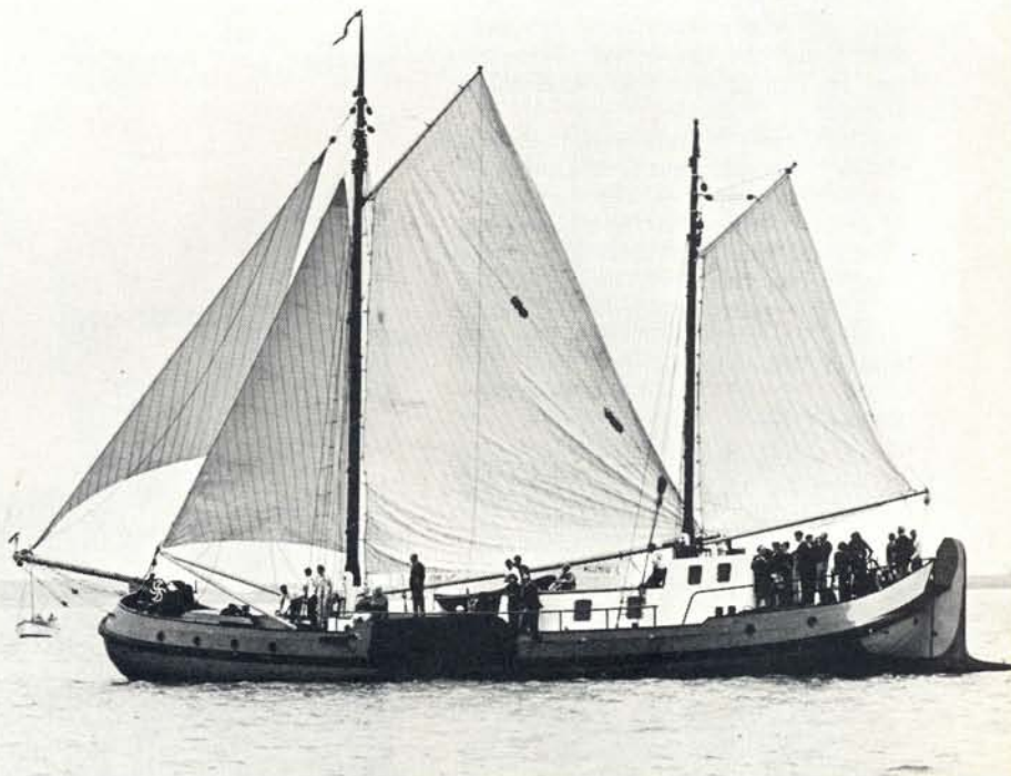
De Zeetjalk Eersteling was een der deelnemers aan de tocht.

En we halen het inderdaad. De strijklaten komen nauwelijks boven water uit. De pomp van de „Bezum” heeft een flinke tijd werk het scheepje leeg te krijgen. Onvermoeibaar wordt nu aan het herstel van de Vrouwe Eliza begonnen. Ze wordt de helling opgesleept, er wordt gebreeuwd, de steven-