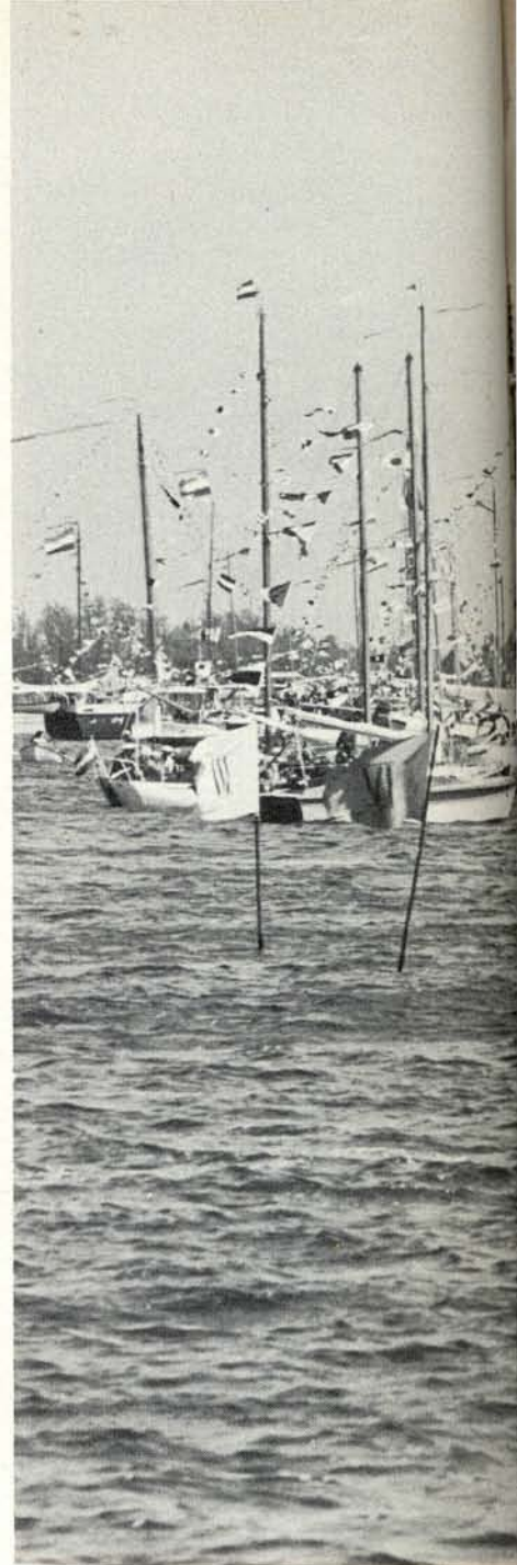
Links, van boven naar beneden: de randmeren, tjalken en lemster- aken tijdens het admiraalzeilen, plus een luchtfoto van de Groe- ne Draeck.