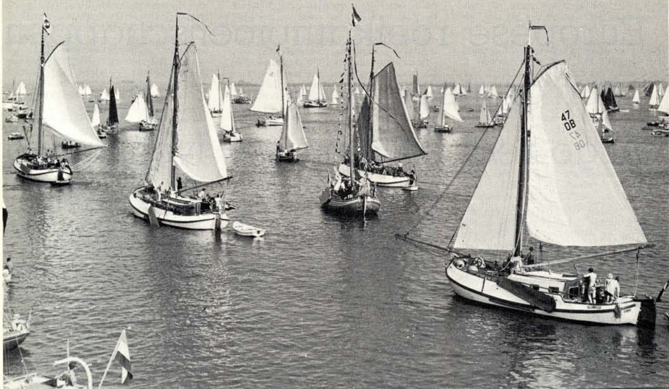
De jachten brengen het generaal saluut aan „hunne hoogheden” op het statenjacht, dat gepavoiseerd ten anker ligt (foto boven).