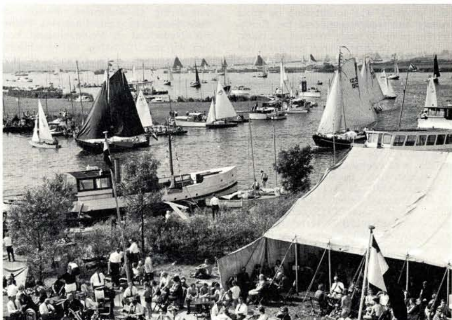
In een lange rij komen de ronde- en platbodemschepen naar het Sneekerveer. Op de voorgond een hoekje van het starteiland; op de achtergrond het Prinses Margrietkanaal en de Houkesloot (foto rechts midden).