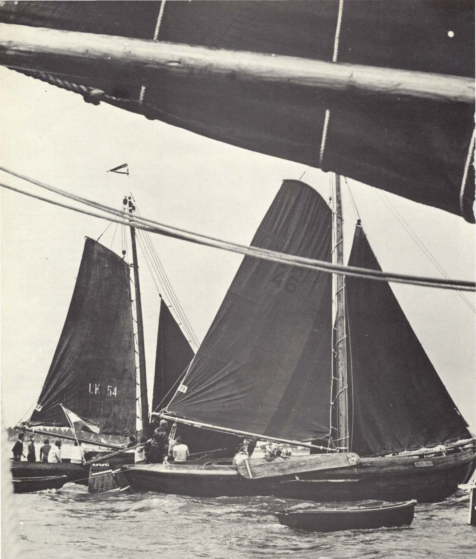
3e Lustrumreünie van de Stichting Ronde- en Platboord