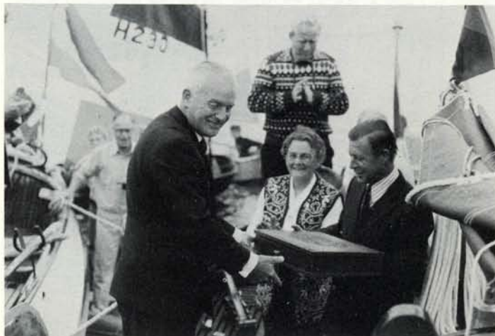
Het kamferhouten kistje van de Pelgrimsvlag

Op zaterdagmiddag 20 augustus lagen op het Braassemermeer een kleine dertig rond- en platbodems „mooi te wezen” . . . getrost en gepavoiseerd en met alle toeters en bellen op scherp. De jaarlijks terugkerende overdracht van de Pelgrimsvlag zou beginnen.