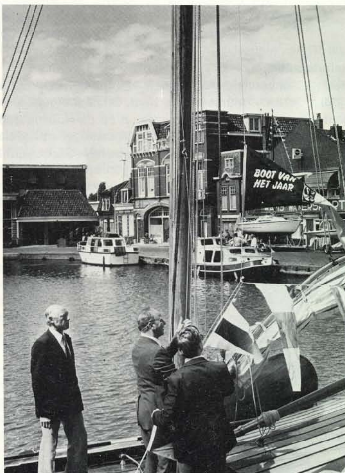
Hijzen van de wimpel