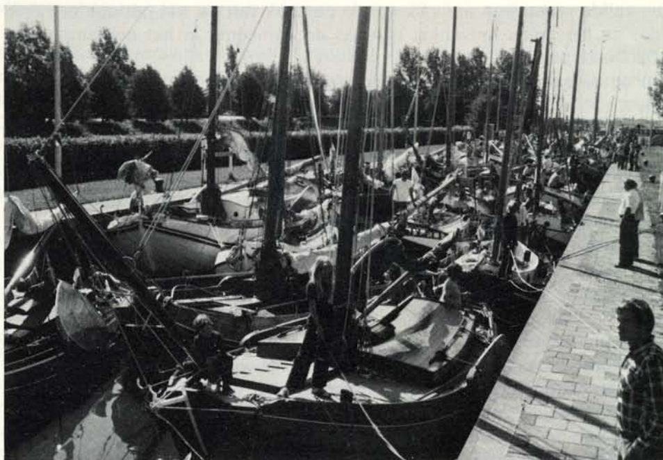
Een keurig staaltje van organisatie en gedisciplineerd varen