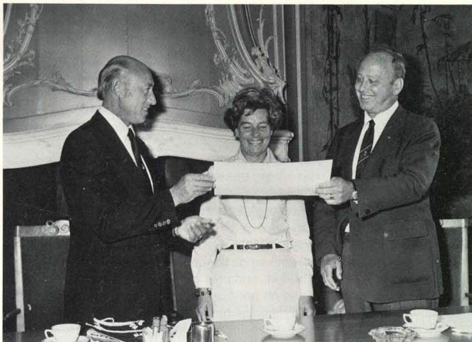
Uitreiking oorkonde van het jaar