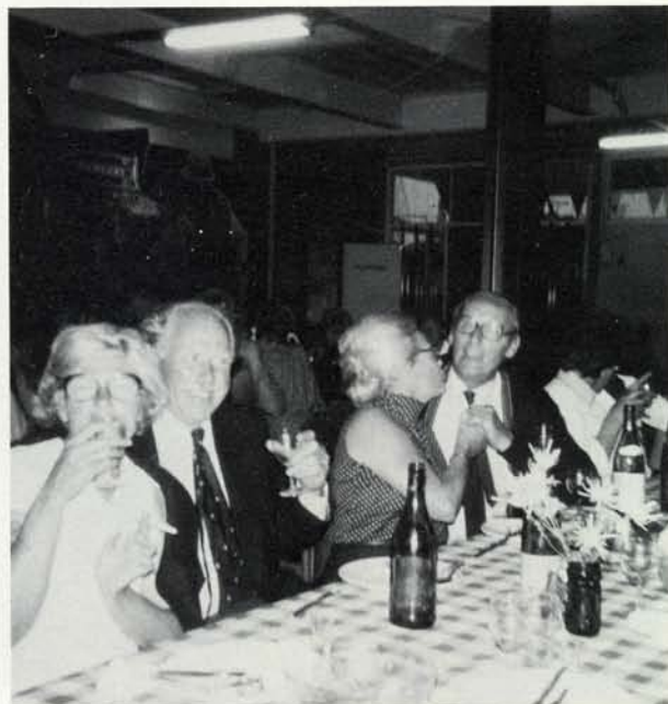
Het gezamenlijk diner

De voortzetting van de tocht, de schepen per eskader, eskader-commandanten met Groningse stedenvlaggen in top, door het kronkelende Reitdiep was, zowel voor deelnemers als voor toeschouwers, een onvergetelijk gezicht. Hartelijke ontvangst in Zoutkamp, opmerking van een buitenstaander: wat lag die vloot in de kortste keren afgemeerd!