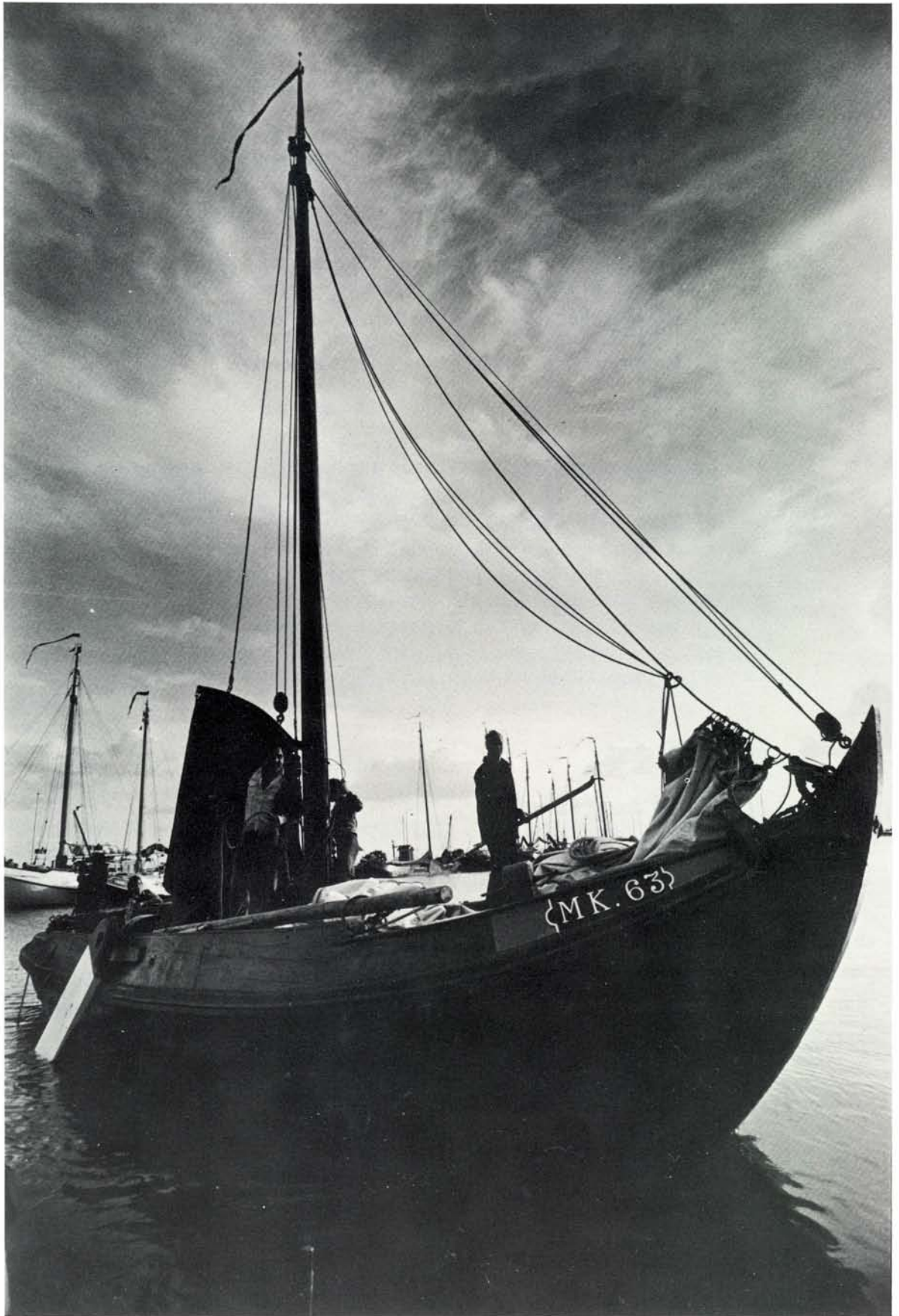
Zeildag met Nieuwspoor