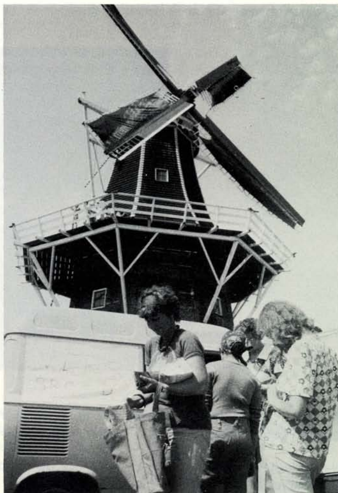
Warm de bakker