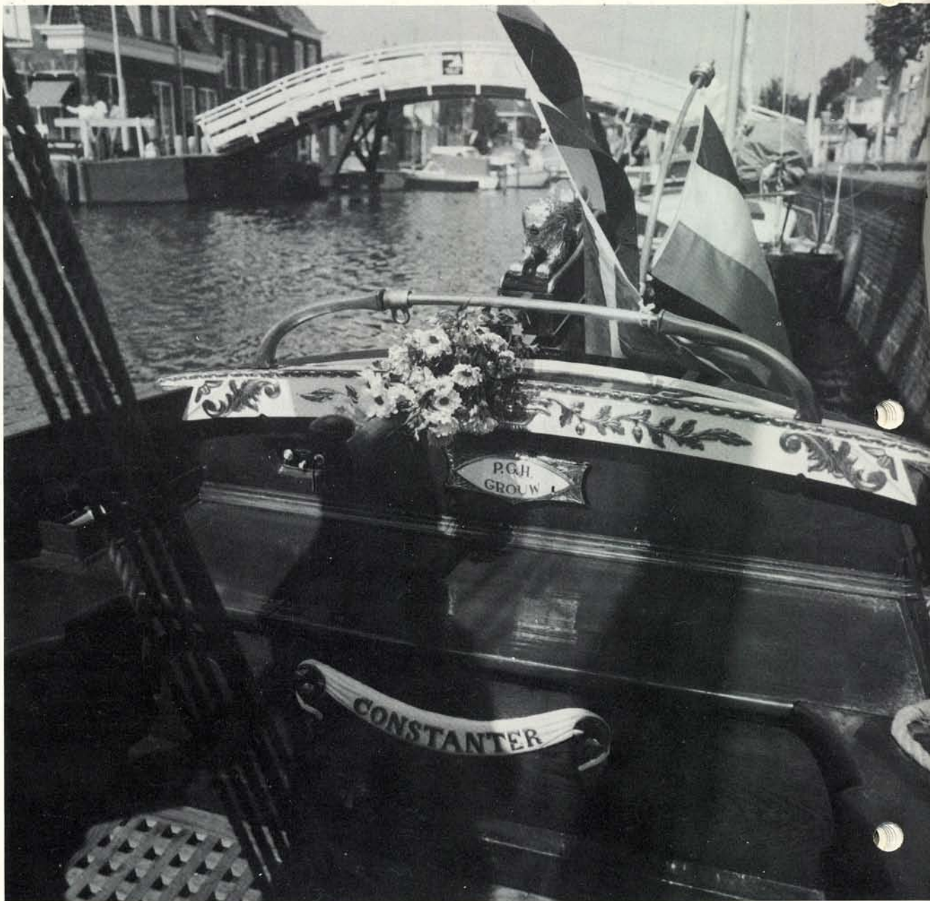
Het boeket op de ereplaats