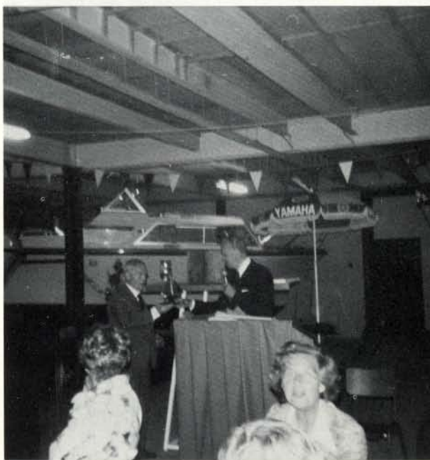
W. H. de Vos-prijs