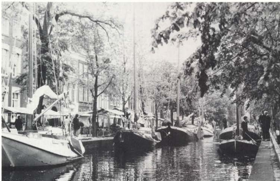
Lente feest 1983. Rechts op de foto de twee prijswinnaars: de tjotters 'Ideaal' en de tjalk 'Bereklauw'.