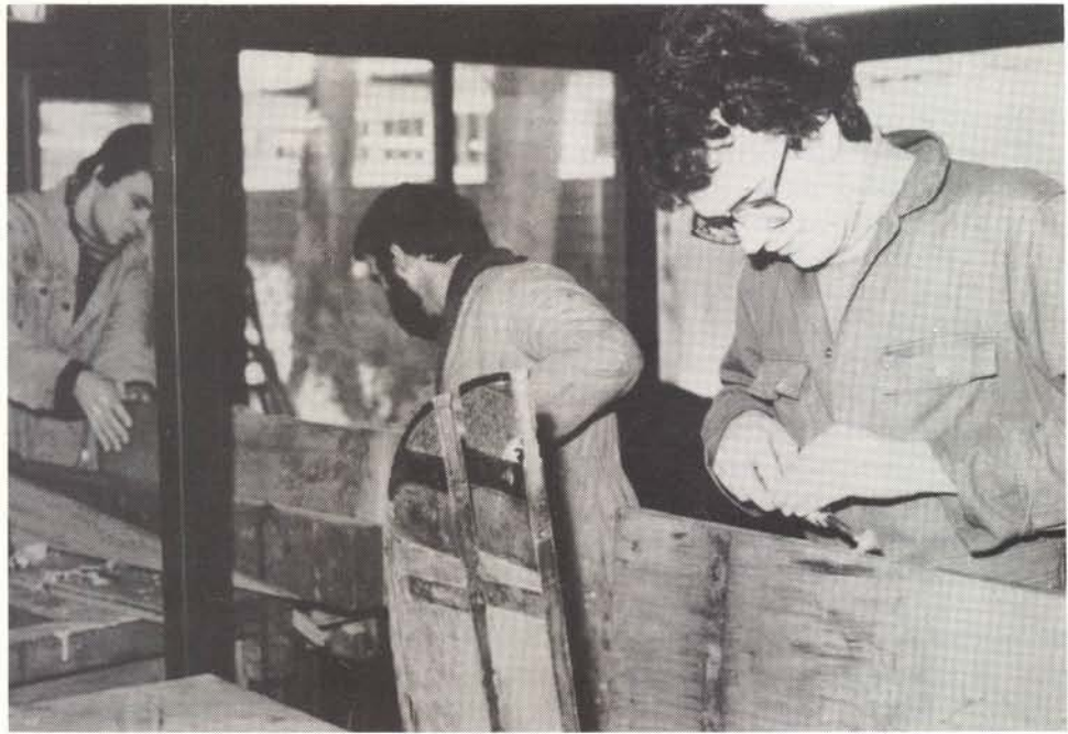
Restauratie tjotters. Jeugdherberg 'It Beaken'.