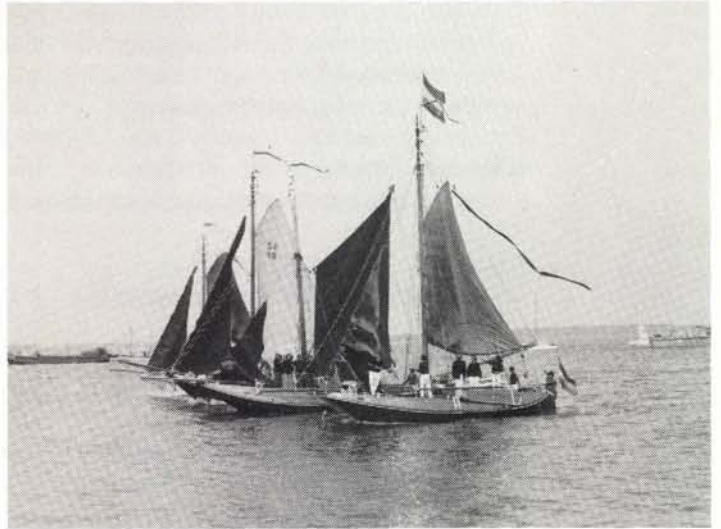
Eskader Hoogaarsen in aantocht.

dat hij van jongs af aan de zaak van het traditionele zeilschip met hart en ziel was, en nog steeds is toegedaan;