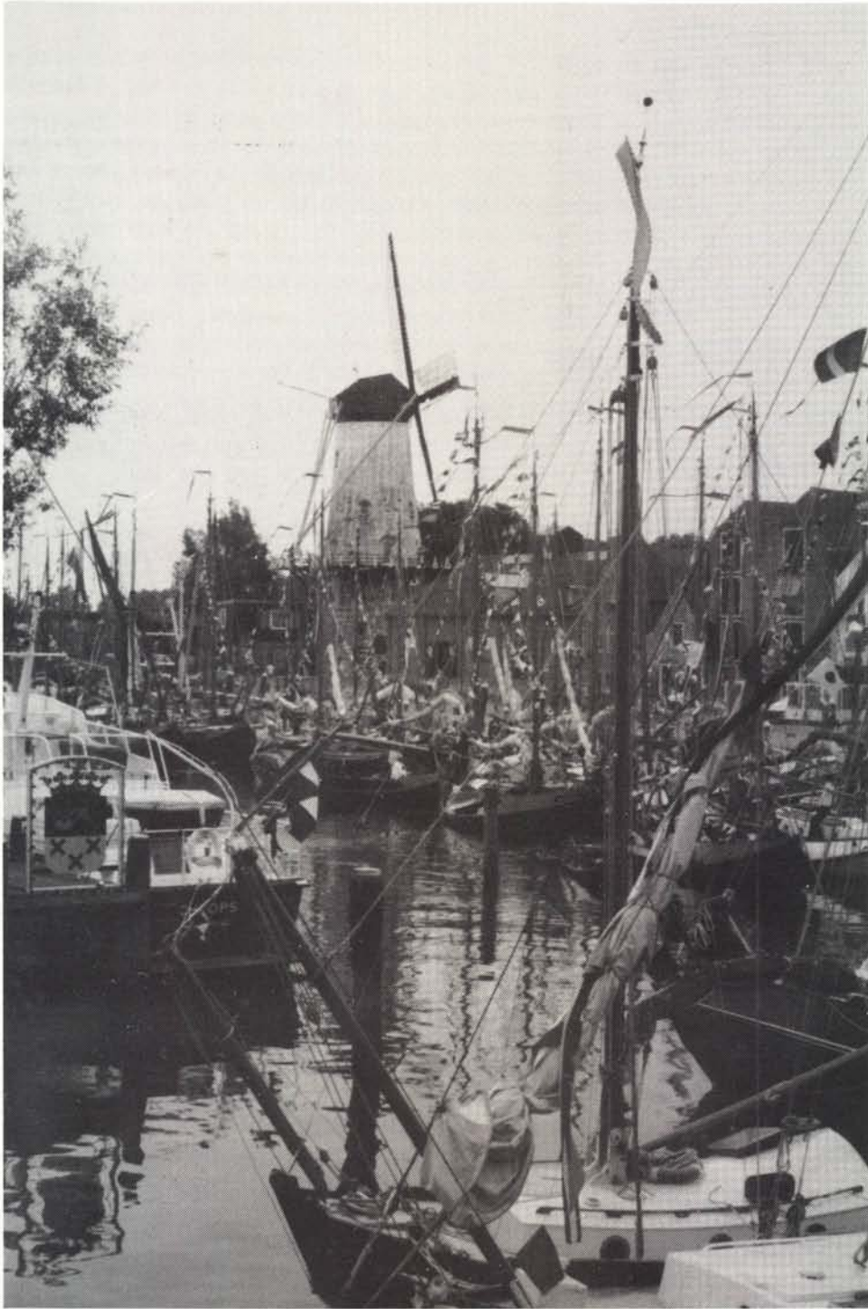
Haven Willemstad met molen op de achtergrond.