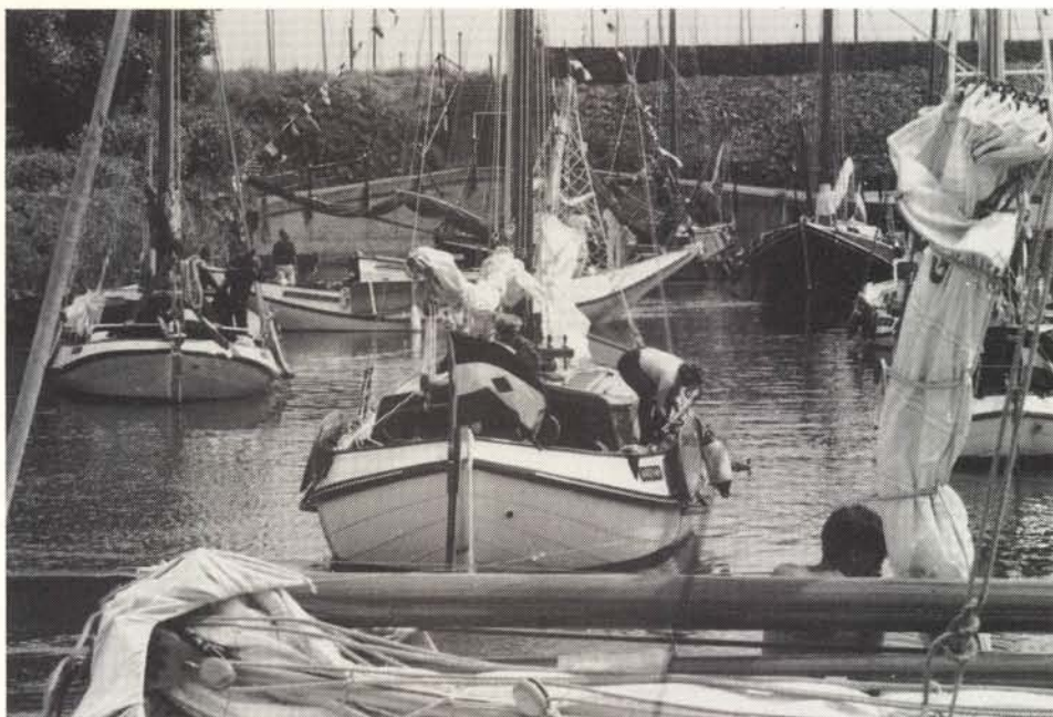
In de haven van Willemstad.