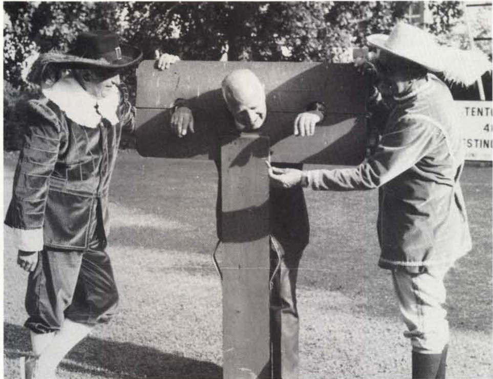
Op het grasveld voor het Mauritshuis.