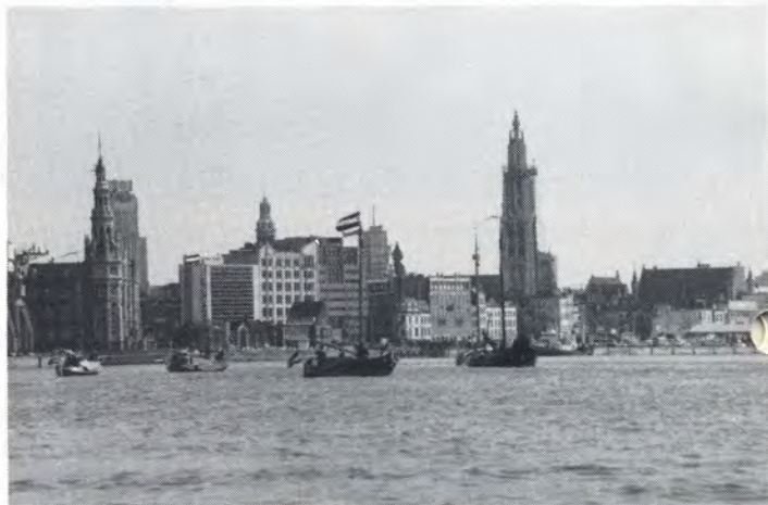
Antwerpen, een schitterend decor voor admiraalzeilen