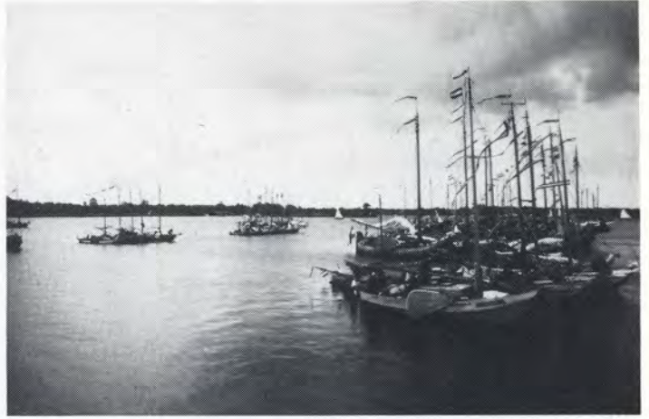
Verzamelen op het Zonsmeer

Daarmede spoelde ook voor velen de herinnering aan de lustrumviering van vijf jaar geleden zonder pardon naar de vergetelheid.