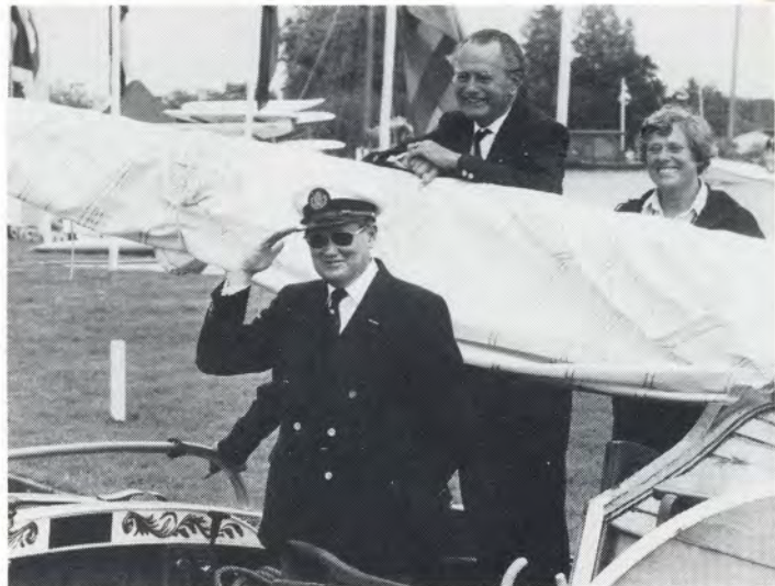
Admiraal H. Wiegel

zaakte helaas enkele brokken, maar het regende niet, integendeel, en dat was al heel wat waard, want daarmee kon deze zesde zomerreünie toch nog in stralende zonneschijn worden beëindigd.