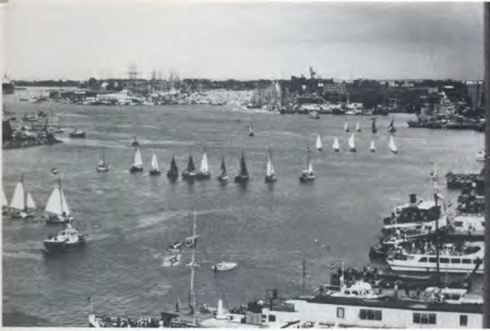
Admiraalzeilen volgens een strak schema