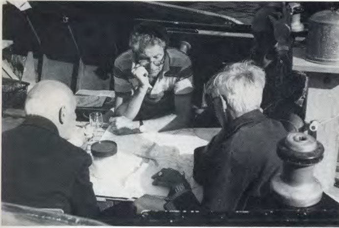
'Palaver' op weg naar Antwerpen