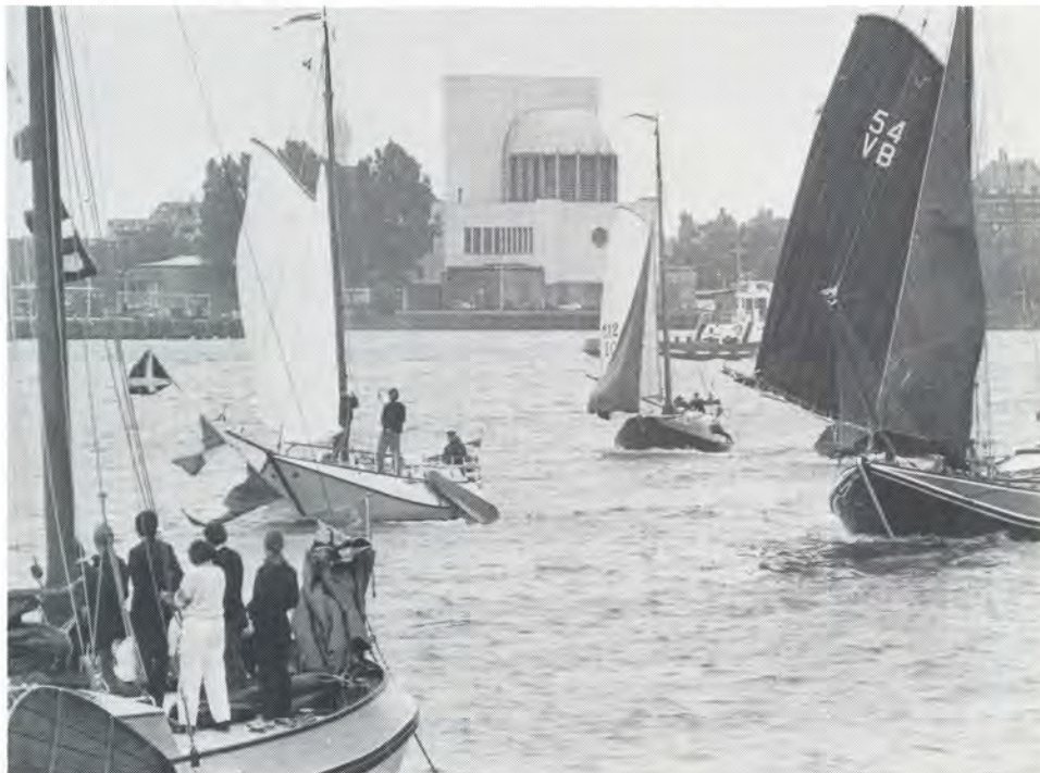
Admiraalzeilen op de Maas