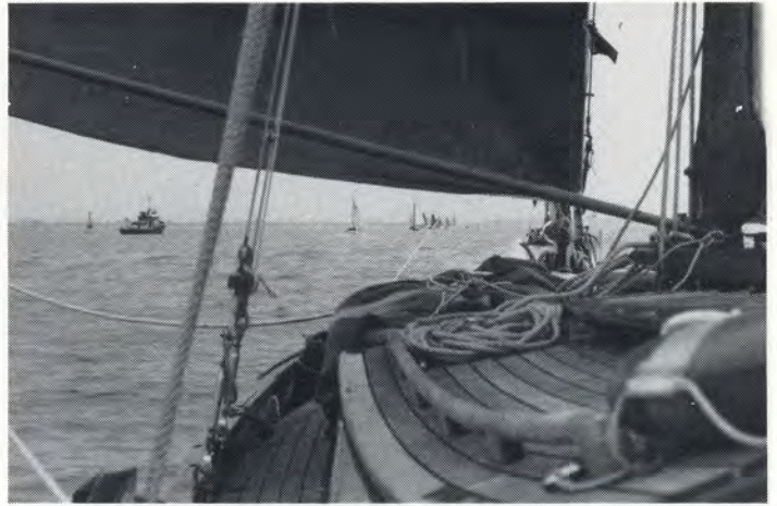
Hansweert - Antwerpen