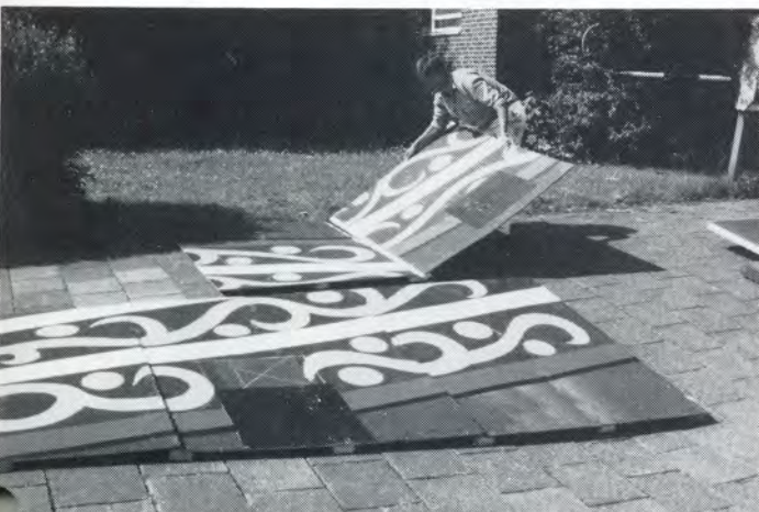
Bouw van een slagschip