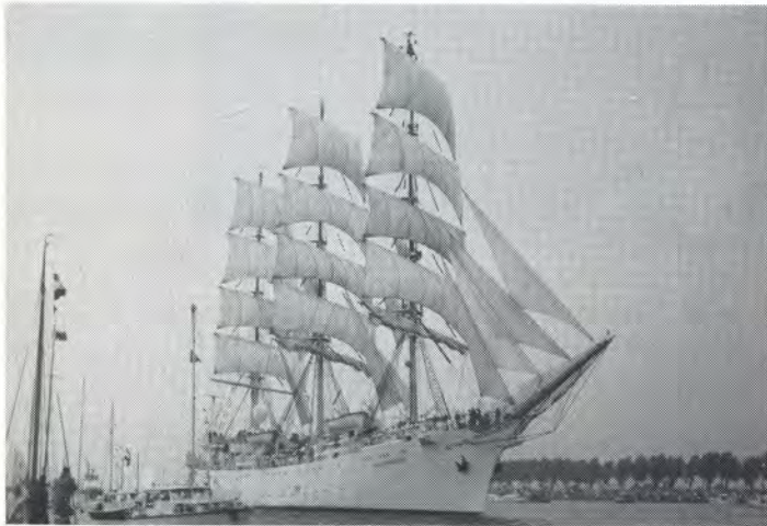
Parade of Sail