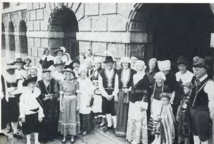
Antwerpen, ontvangst ten stadhuize

's Avonds werd het herstel van de stad waardig gevierd. Met donderend geweld