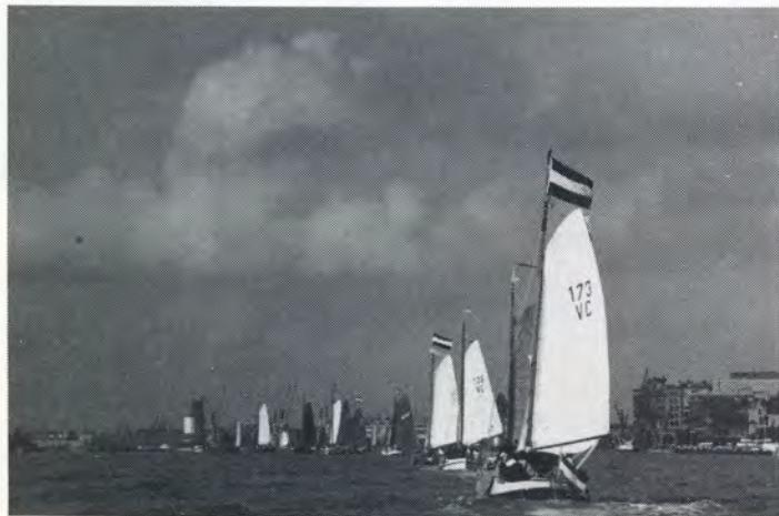
Admiraalzeilen op de Schelde

Zondagmorgen 7.30 uur: de bruggen draaien om de vloot van ronde en platbodemjachten door te laten voor de thuisvaart.