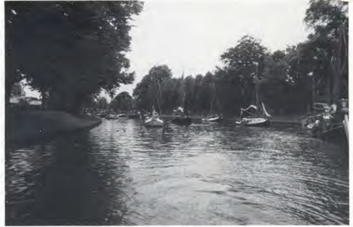
Vertrek uit Leeuwarden