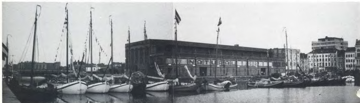
Formatie voor het waterspel