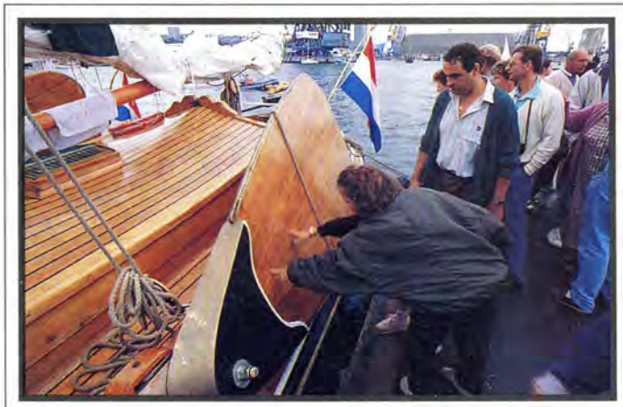
De Fransen hebben geen idee waar zwaarden voor dienen en willen er even aan zitten. Zelfs de uitleg dat zwaarden als een soort schild dienden bij aanvallen geloven ze onmiddellijk.

dan onze totale jaaromzet! Daarom zijn we ook zo blij dat het druk is! (Een volwassen bezoeker betaalt tachtig francs entree, HS). We hebben ons zelfvertrouwen continu moeten oppeppen en nu blijkt dat het een succes is, werkt dat enorm stimulerend. Voor alle vijfduizend vrijwilligers.'