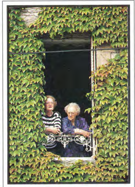
Als je aan de kade in Douarnenez woont hoef je je niet tussen de mensen te wringen. Dat zijn deze dames ook absoluut niet van plan.

Op het oude blusschip zingen twee Bretonse vrouwen met gedreven, vinnige stemmen liedjes van heel vroeger. Gelukkig kunnen ze lachen als het uit is. De Noren in hun vikingsschip vinden er niks aan. Ze drinken veel goedkope whisky en worden snel dronken. De Noorse kolonie ziet eruit zoals je van ze