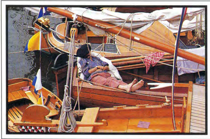
Terwijl de meeste bemanningen de kant op zijn om te passagieren en zo bij te komen van een hele dag dobberen, kiest deze schipper voor een andere manier van ontspannen.

was een soort test voor ons uiteindelijke doel: een reis naar de Verenigde Staten in 1992. De tocht om Engeland is uitstekend verlopen voor schip en bemanning, maar het noodzakelijke sponsorgeld hebben we niet bij elkaar gekregen.'