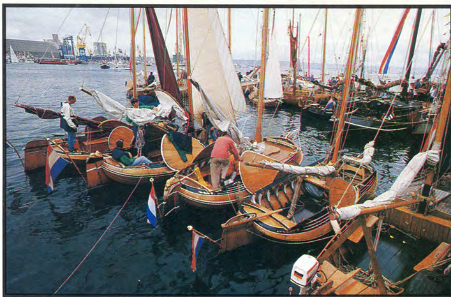
Twintig Nederlandse ronde en platbodems kwamen per coaster naar Brest. Het blanke hout en de gouden versierselen trekken veel aandacht tussen de sobere werkschepen.

zwart geklede blazers vrolijke muziek te maken met ingestudeerde danspasjes. Het is eens wat anders na alle doedelzakken en schelle fluitjes. Een scheepstoeter applaudiseert na het nummer, de trombone groet terug. Ze spelen een beetje vals, maar dat is nou net zo leuk. De muzikanten trekken het dorp in en wij lopen achter ze aan. Douarnez is een grote vissersplaats, maar ook een echt vakantiedorp, met van die Franse souvenirwinkels waar je opblaasbare palmeneilanden, kranten en espadrilles kunt kopen. Er hangt een zonnige sfeer. Je hoort Spaans, Engels, Nederlands en Frans spreken. Alle winkels zijn open en schippers en bemanningen zeulen met stokbroden en trays bier terug naar de bijboot. Die liggen in groten getale op de trailerhelling, je zou je makkelijk kunnen vergissen. Aan de andere kant van het dorp kom je in de oude haven die nu vol