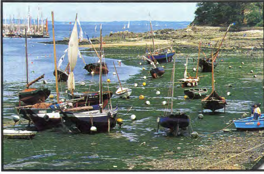
Bij laag water lig je in Douarnenez in een soort weiland. De Franse schepen zijn er op ingericht; aan weerszijden van het schip zijn stutten gemaakt zodat ze niet omvallen.