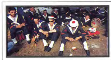
De muzikanten van de marine houden het muziek maken niet lang vol.