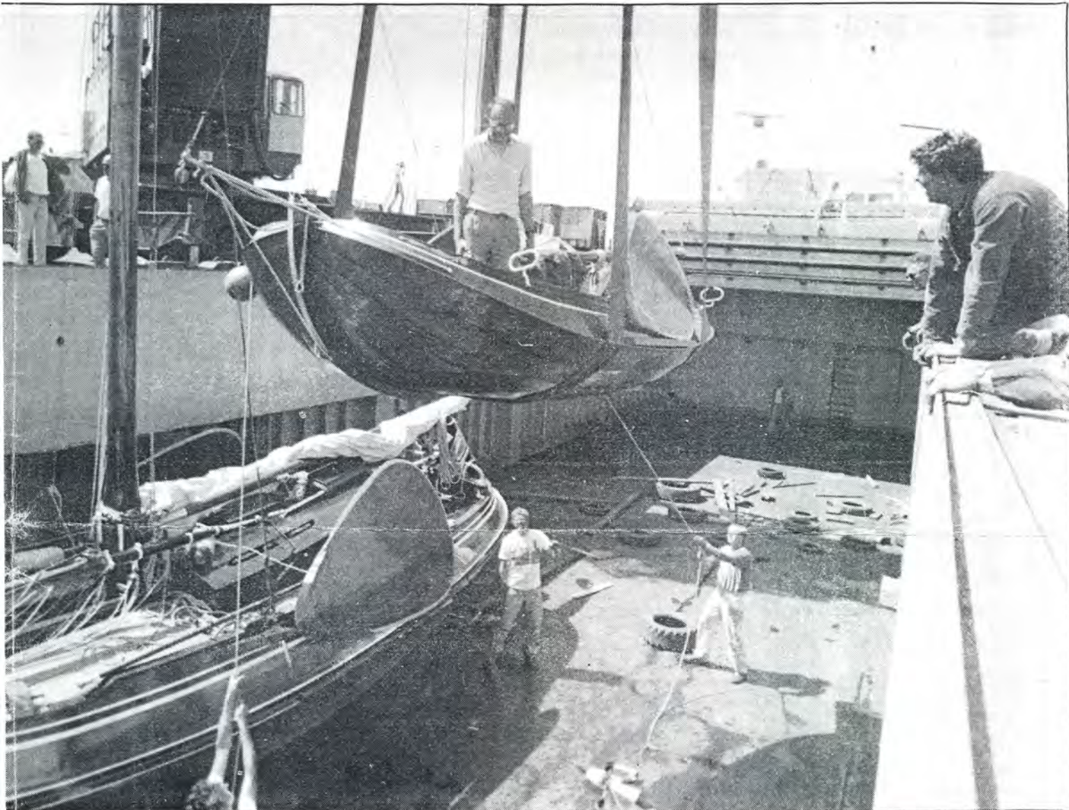
De Nederlandse zeilvloot in het ruim geladen. Door het opblazen van stevige luchtzakken kan schade worden voorkomen.

meter. Toch leggen de booteigenaren de transport-som met liefde op tafel. 'Dat vaarfeest in Brest wordt eenmalig. Je ontmoet er gelijkgestemden uit de hele wereld', betoogt Sicco van Albada. 'Ze komen uit alle windstreken. Nieuw Zeeland, Polynesië. En dan zouden we uit Nederland ontbreken zeker?'