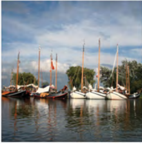
Aanbrengtocht Lustrumreünie 2010