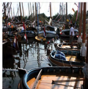
Lustrumreünie 2010 Gallamadammen