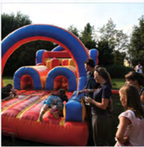
Lustrumreünie 2010 Gallamadammen