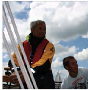
Lustrumreünie 2010 Gallamadammen