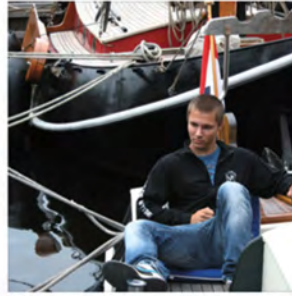
Aanbrengtocht Lustrumreünie 2010