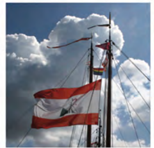
Aanbrengtocht Lustrumreünie 2010