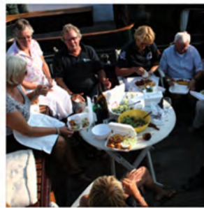
Aanbrengtocht Lustrumreünie 2010