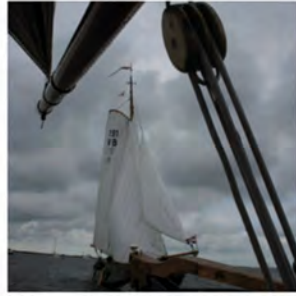
Lustrumreünie 2010 Gallamadammen