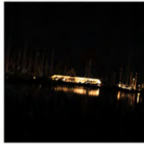
Lustrumreünie 2010 Gallamadammen