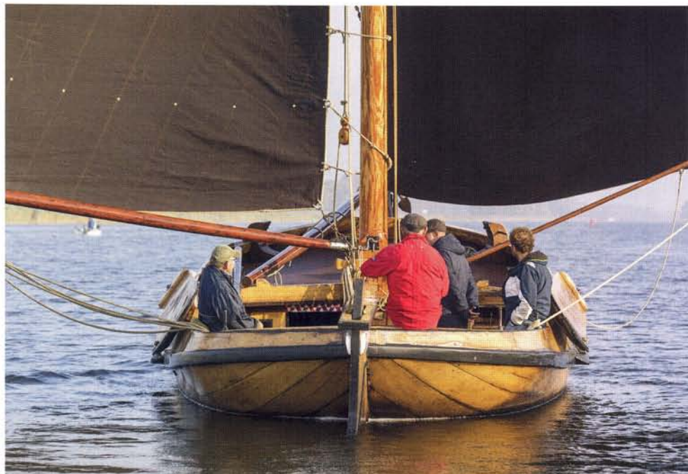
Kenmerkend voor de bons is het brede achterschip

in 1968 de Jonge Pieter aan voor 2400 gulden als één van de laatste overgebleven bonzen. Het museum had als doelstelling om van alle scheepstypen, waarmeer rond 1900 gevestigd werd op de Zuiderzee, minstens één exemplaar te hebben. Het museum had al eerder twee bonzen aangekocht, de EB 45 en EB 67, maar door het ontbreken van financiële middelen om ze te restaureren was de EB 45 gesloopt. De EB 67 was later door Enkhuizer jeugd in brand gestoken. Voor de EB 39 leek de toekomst ook onzeker. Vele jaren stond de bons op de wal naast de hellingschuur van de Markerhaven van het buitenmuseum te verpieteren zonder dat het ooit tot een restauratie kwam. Het is de Elburger Botterstichting een doorn in het oog, zij wil de bons graag terughalen naar Elburg om te restaureren, maar het Zuiderzeemuseum is daar nog niet aan toe.