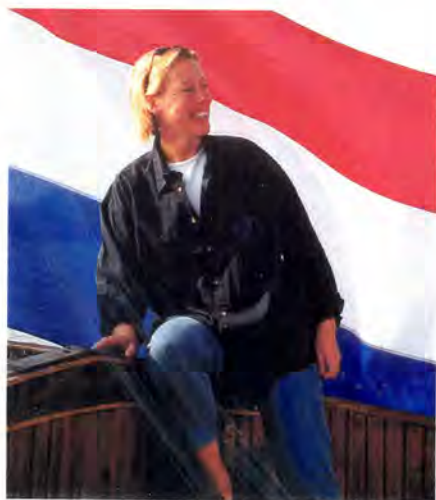
Waldien is gekleed in de marineblauwe blouse met logo

Totaal bedrag _ .... Over te maken op Banknr. 370666186 t.n.v. Comité Regionale Friese Reünie