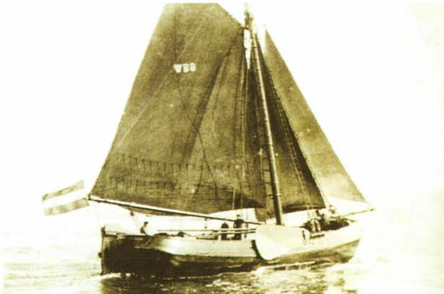
Foto links: Palingaken aan hun mooring op de Theems. Boven: opname van een palingaak. Onder: Bij zo'n eerste paal hoort een feestje met cadeau.

Het boek 'De helling onder Heeg' is verkrijgbaar via Jachtwerf Pier Piersma, tel. 0515-442558/442680 of kijk op www.piersma.nl