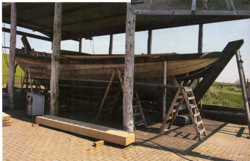
Een groot deel van de huid van de Wierumer Aek is al dicht.