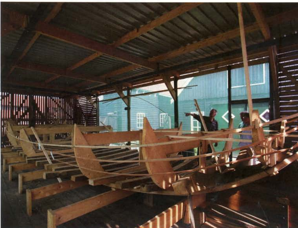
Aan het houten skûtsje Aebelina wordt weer gewerkt. De komende maanden komen de huidgangen op hun plaats.