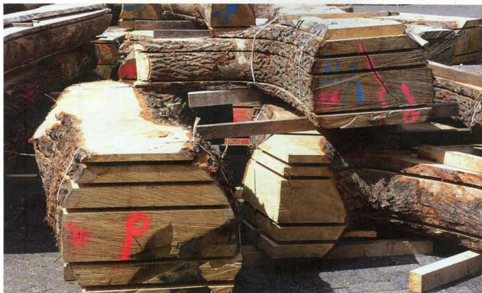
Het hout voor de krommers ligt klaar in Heeg.