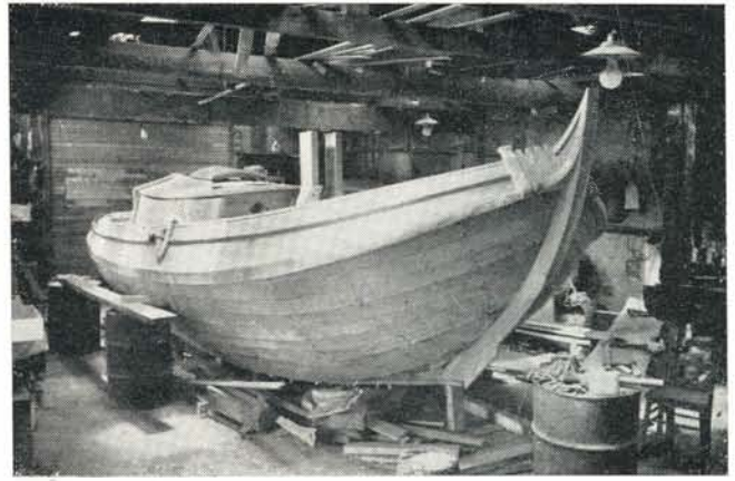
De Njord in aanbouw in 1954.