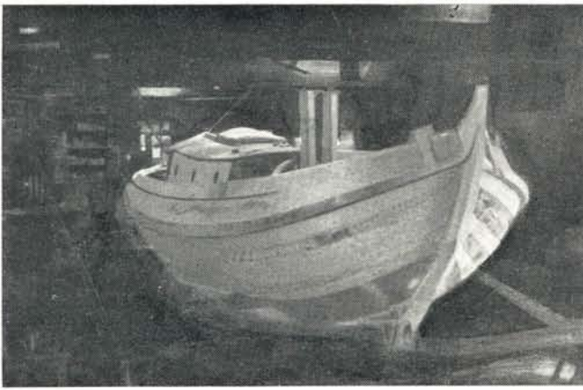
De Vollenhovense Bol Goetzee in aanbouw in 1939.