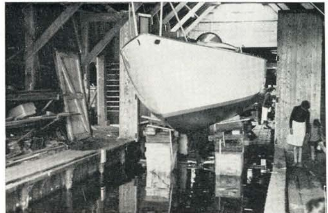
De tewaterlating van de Najade van de Koninklijke Marine Jacht Club in 1959.