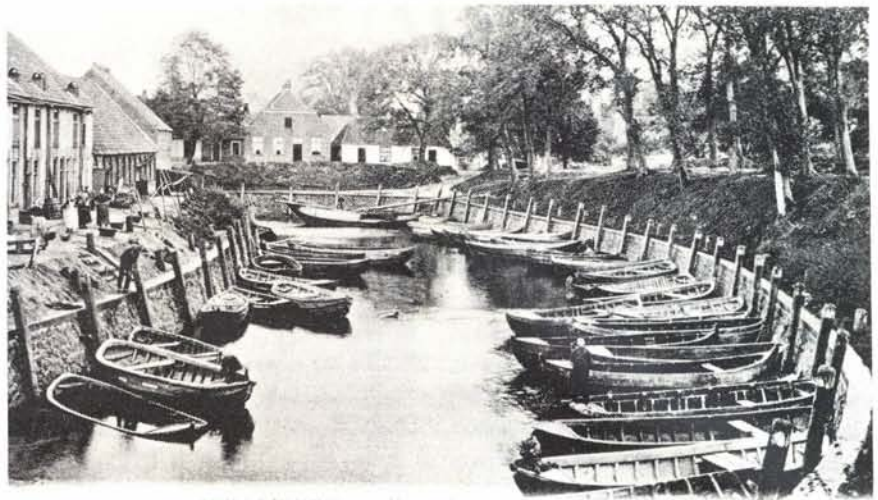
DE BUITENHAVEN, Houtwerf