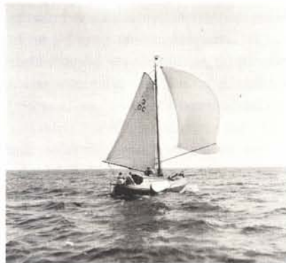
De Vrouw Lucia was voor deze race uitgerust met een splinternieuwe ballonfok; het was een nieuwigheid voor dit soort schepen. De voorsprong die de Goetsee in het in de windse rak behaald had, ging naderhand verloren.