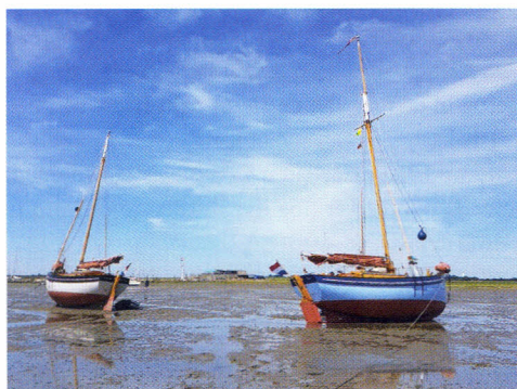
Drooggevalen kotters van Peter Schouten

'Al jaren liep ik rond met het idee een boek te maken met daarin de verhalen van houten botenbouwers. In 2020 had ik eindelijk de mogelijkheid bij tien van hen langs te gaan om hun verhalen vast te leggen. Op afstand vanwege het