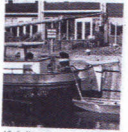
Abt. 8. Kip van een Huisfluitant