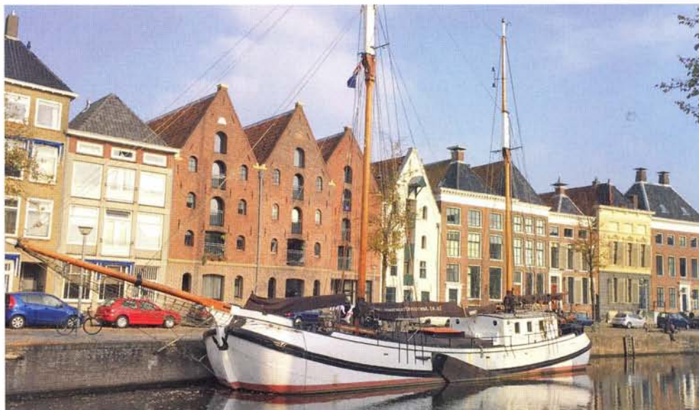
boven: De Voorwaarts Voorwaarts lag in Groningen afgemeerd

- kwam men tot een eensluidende keus voor één partij: Lex Tichelaar van SRF Holland, een werf waar tijdens de bankencrisis en ook in de magere jaren erna, hard kon worden doorgevoerd. Na aankoop werd de koftjalk naar de werf in Harlingen gebracht en werd het schip