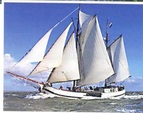
boven: Ne een complete refit ligt de grote koftjalk te pronken voor de loodsen van SRF