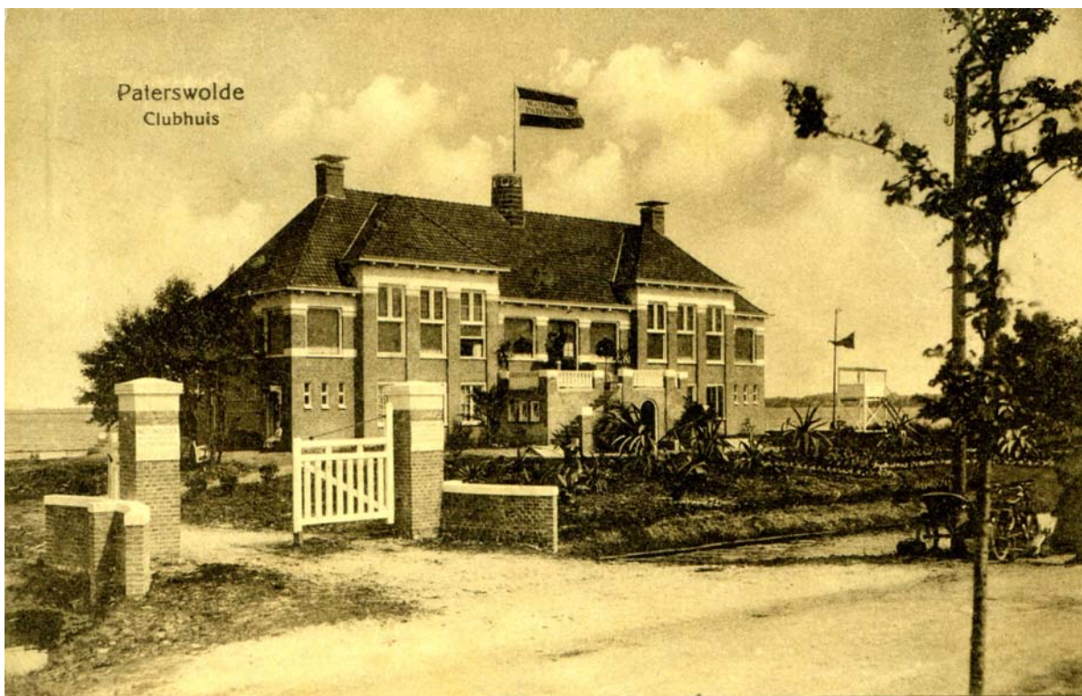
Clubhuis 27 mei 1917. De onverharde weg heette toen nog Kunstweg. Tegenwoordig is dit de Meerweg. Let op de verschillende stand van de vlaggen op het paviljoen en de starttoren. Het clubhuis is ontworpen door architect Jan Kuilen. Zowel paviljoen als Kunstweg (Meerweg) zijn tot stand gekomen mede dankzij bemoeienis van J.E. Scholten. Op de oorspronkelijke foto staat de vlag op het clubhuis niet afgebeeld. Deze is later ingetekend.

De oprichtingsdatum is wel bekend: 3 juli 1911. De statuten werden goedgekeurd bij Koninklijk Besluit nr. 45 op 14 december 1912.