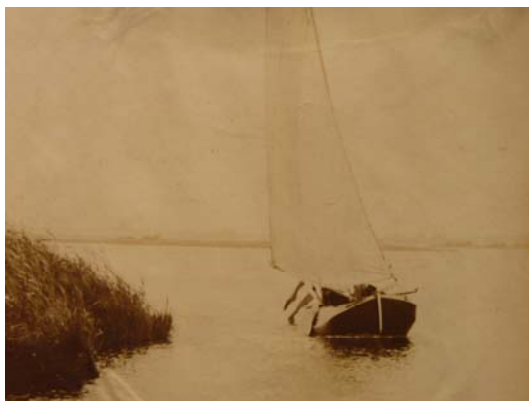
tjotter Dolfijn van Heukers foto 1911