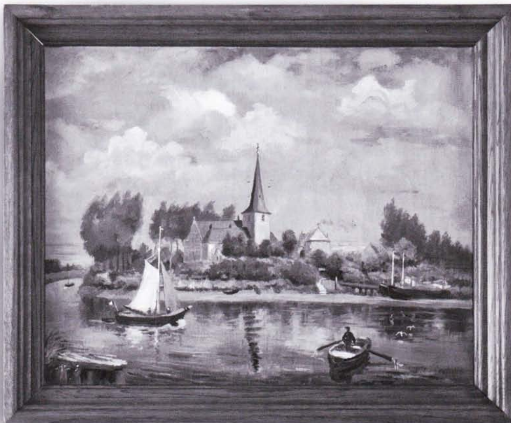
Zicht op Mariekerke van op 't Land. Links voorbij de bocht het Koningsrek. Rechts de veerman.