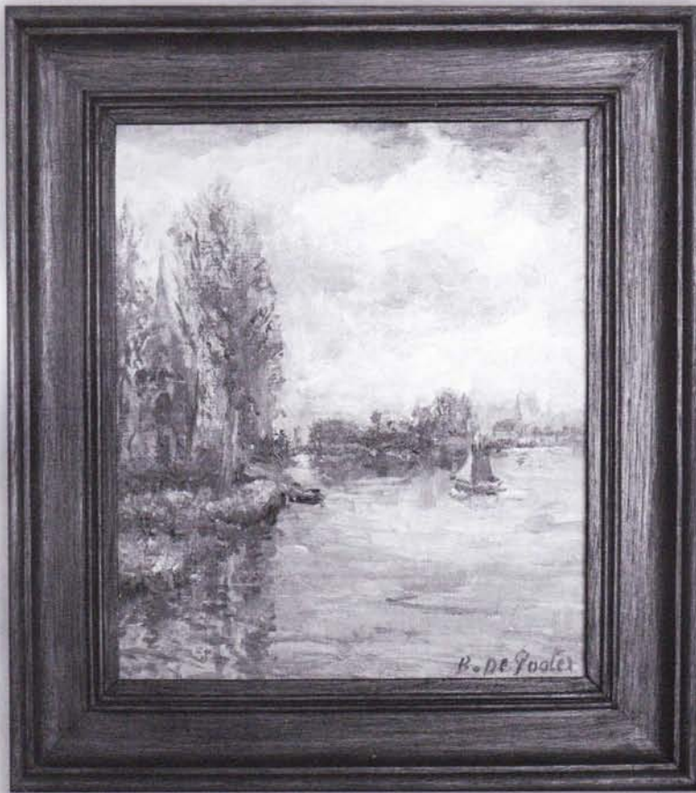
Vanop "de Sluis" zicht op Mariekerke links en St.-Amands in de verte; in het midden het Eiland. (1969 B De Pooter)

gen, de cafeetjes en winkeltjes, de veerman, de veldwachter, de dorpsgek. Over een slechte- en een goede pastoor en over hoe men twee wereldoorlogen overleefde. Over minder en minder vissers toen er niets meer te vangen was.