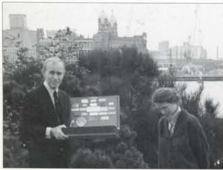
Op de achtergrond de gebouwen waarin vroeger de Holland Amerika Lijn gevestigd was en waarvan daan velen de Pilgrimfathers volgden