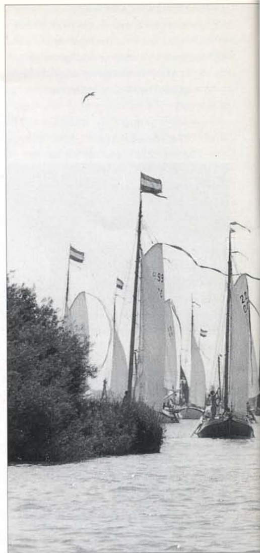
Op de grens van het Pikmeer en het PM-kanaal brachten

Na afloop van het diner had de band, die tijdens de maaltijd al voor wat achtergrondmuziek had gezorgd, geen enkele moeite om jong en oud op de dansvloer te krijgen. Het bleef tot in de kleine uurtjes bijzonder gezellig in de tent.