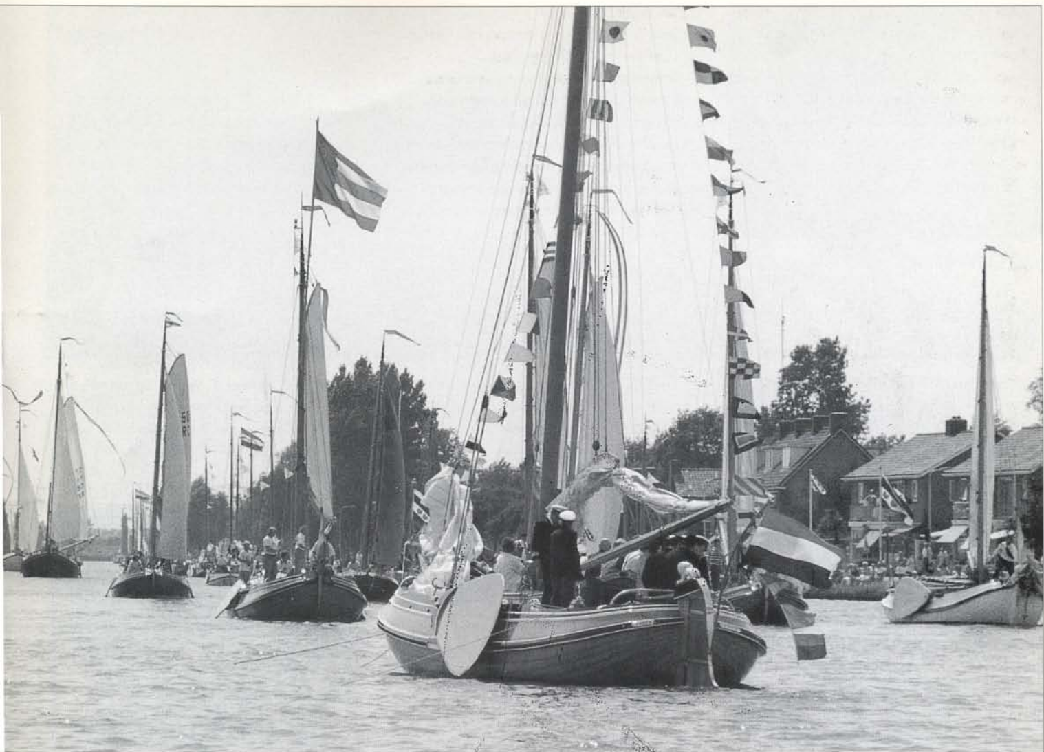
eskaders het saluut aan de Admiraal, de Commissaris der Koningin, aan boord van het honderdjarige Statenjacht Friso