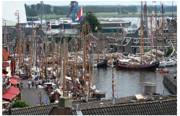
Iedereen weer veilig in de havenkom.