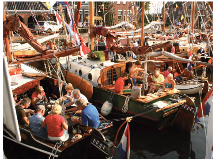
Het nuttigen van grootste drijvende diner.