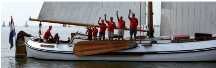
Individuele groet gesorteerd op lengte.