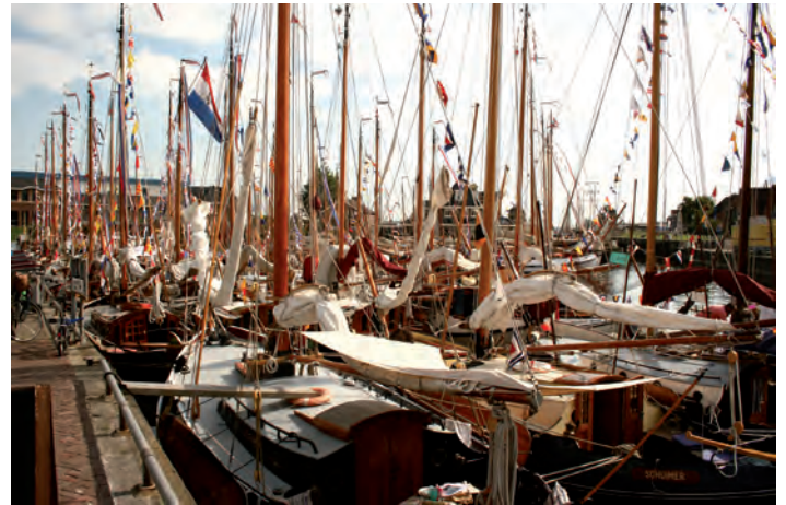
De volle havenkom van Lemmer met bijna 100 schepen.