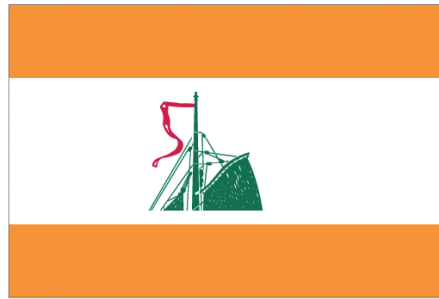
SSRP opgericht 1955