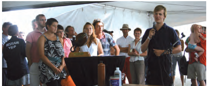
De jeugd zingt de aanwezigen toe met een zelfgeschreven songtekst.