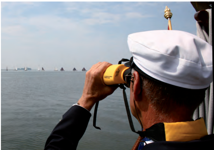
Het schouwspel wordt ook op afstand aandacht beoordeeld.