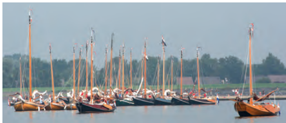
Alle schepen in formatie voor anker.