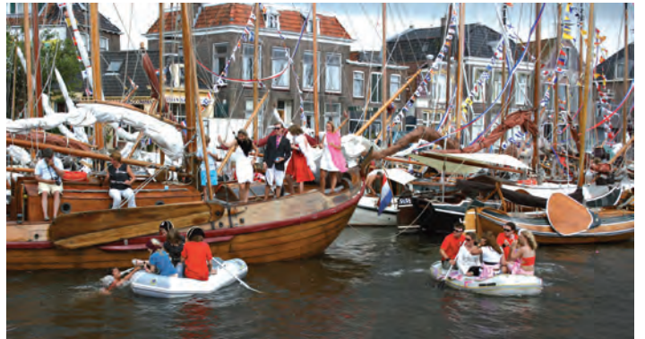
Admiraalroeien door de jeugd in snel verslechterende weersomstandigheden.