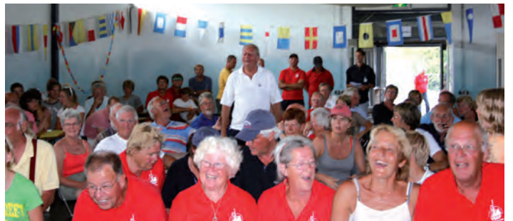
Alle bemanning in blijde afwachting van de uitslag van het wedstrijdzeilen.