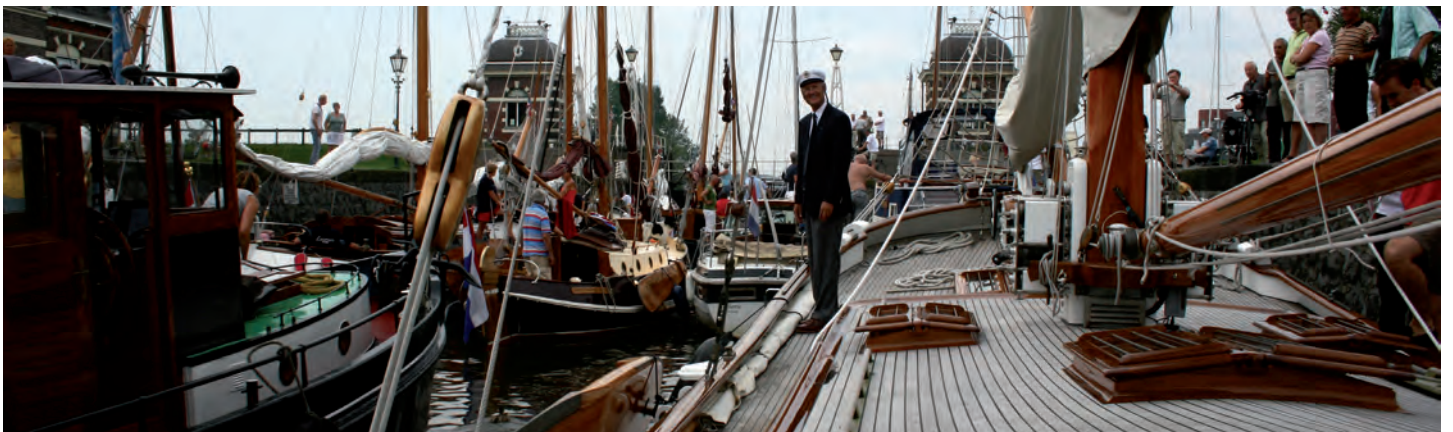
Aan boord van het admiraalschip in de sluis van Lemmer.