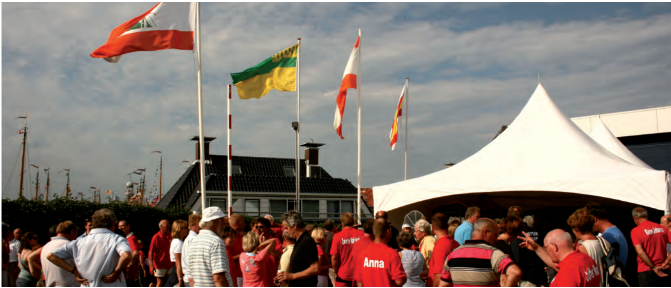
Na het hijsen van de vlaggen (vlnr: SSRP; WSV; VSRP en Gemeente Lemsterland) was de reünie officieel geopend.