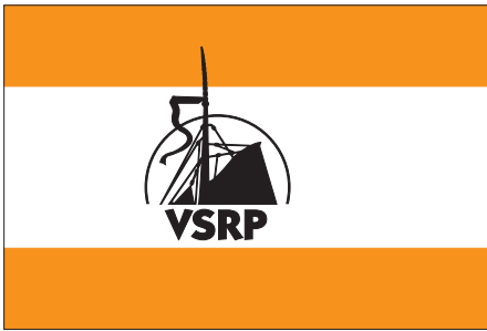
VSRP opgericht 1988