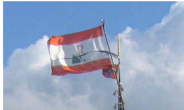
Afbeelding SSRP vlag in top van De Groene Draeck