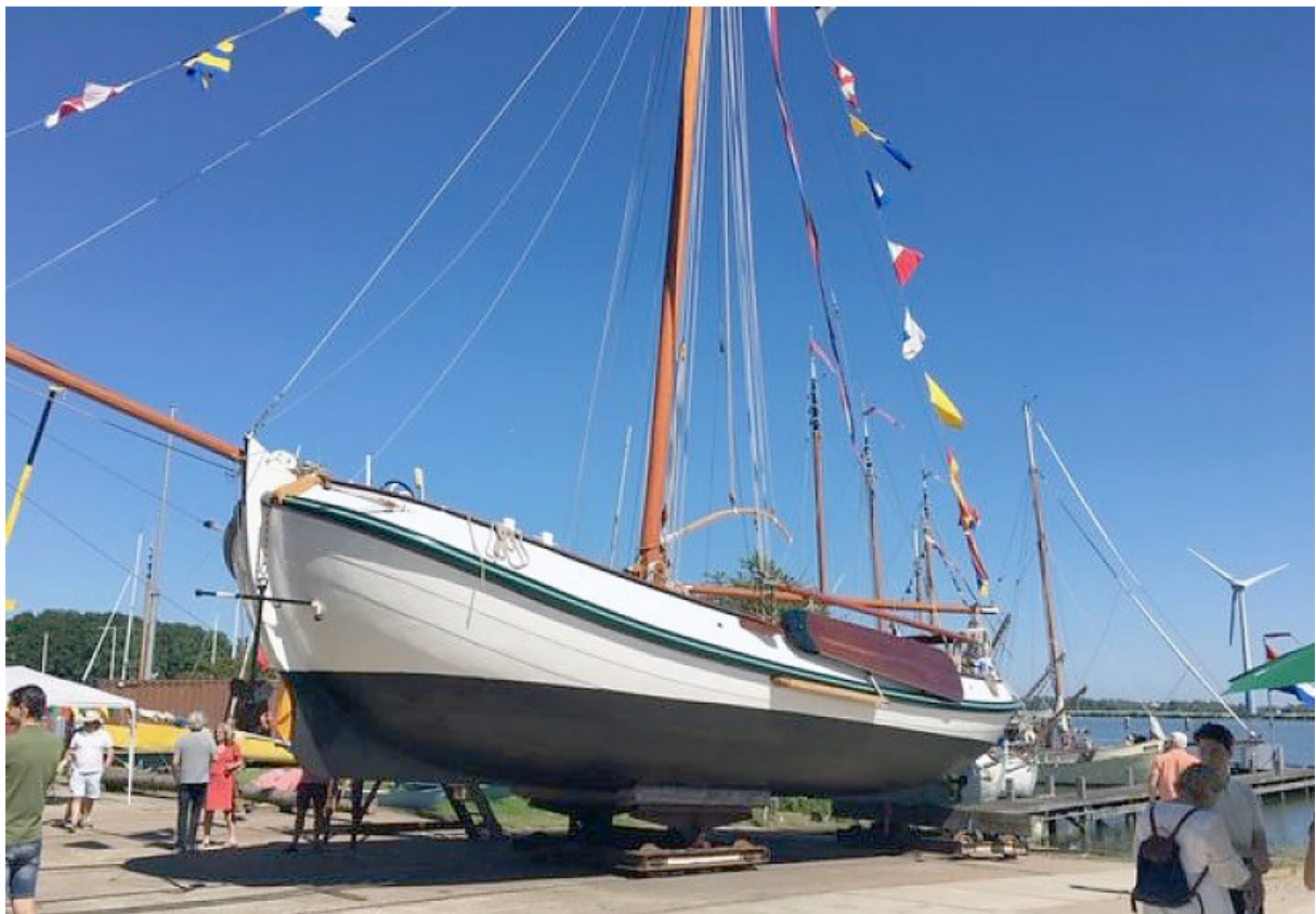
Tewaterlating Lemsteraak 'Salamander' na een uitgebreide restauratie