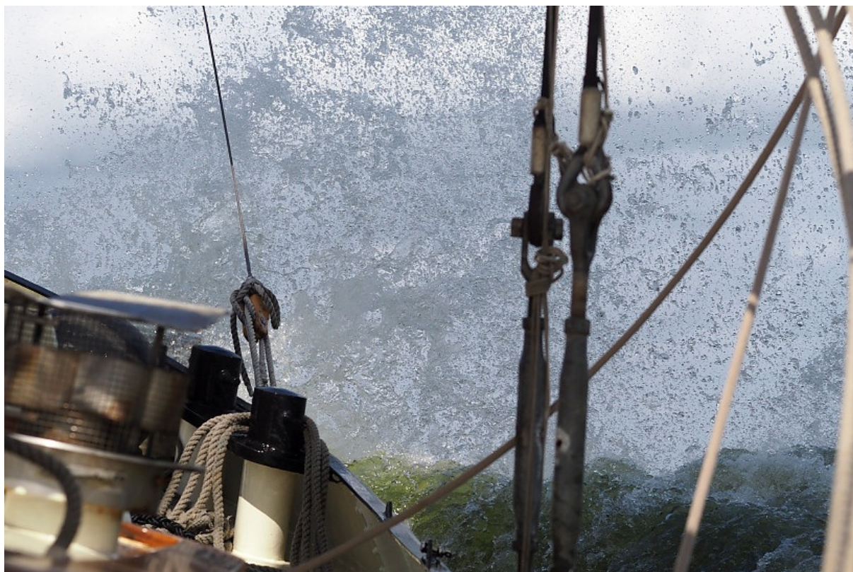
De Lemsteraak (Mosselaak) WL18 in actie

De Stichting Stamboek Ronde en Platbodemjachten is door de belastingdienst aangemerkt als een culturele ANBI