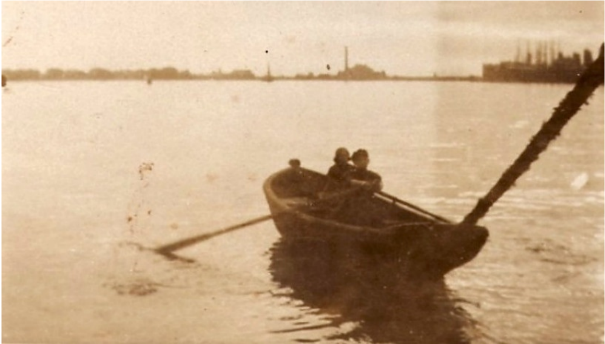
Boegseren : de schipper heeft besloten zijn schip voort te slepen met de roeisloep