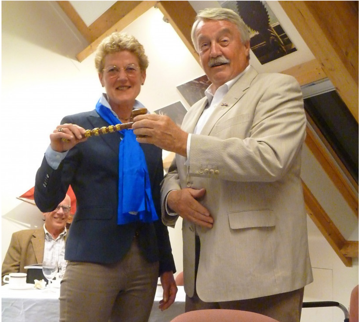
Overdracht van de voorzittershamer