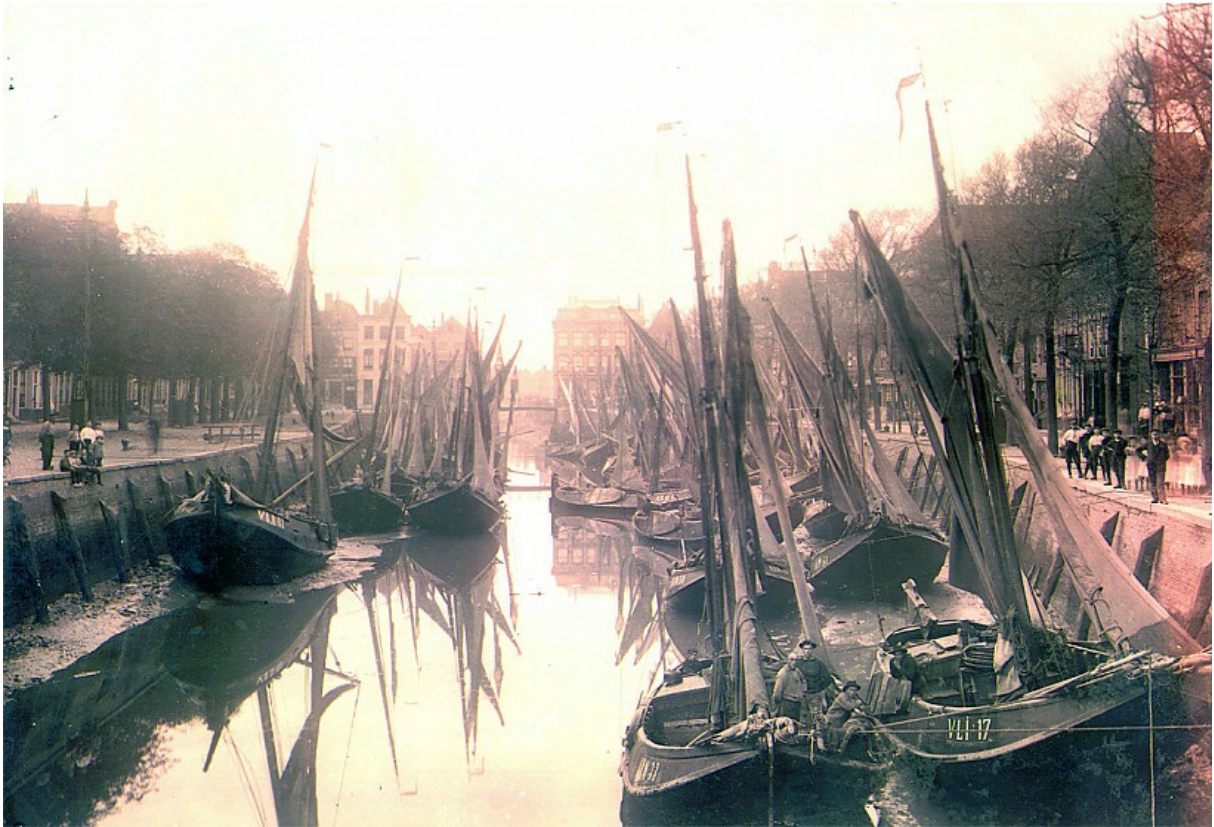
De haven van Vlissingen begin vorige eeuw