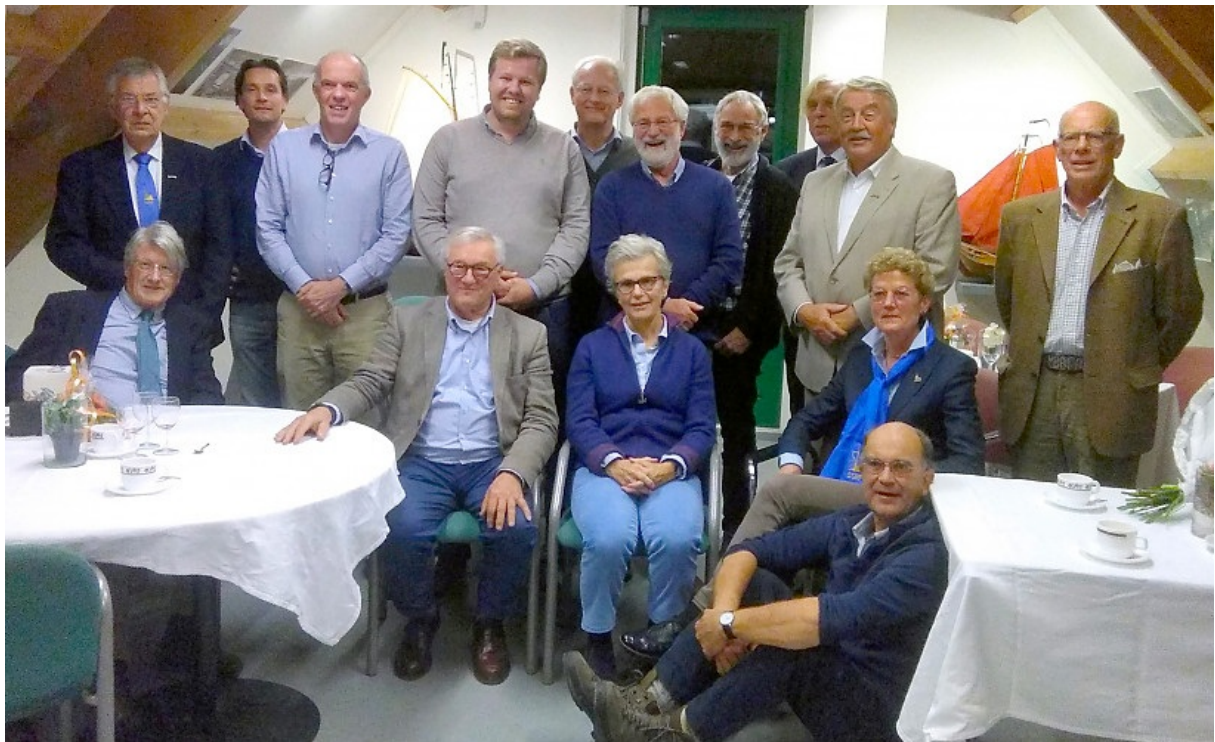
Werkbezoek SSRP Bestuur en Commissies aan de werf in Arнемuiden