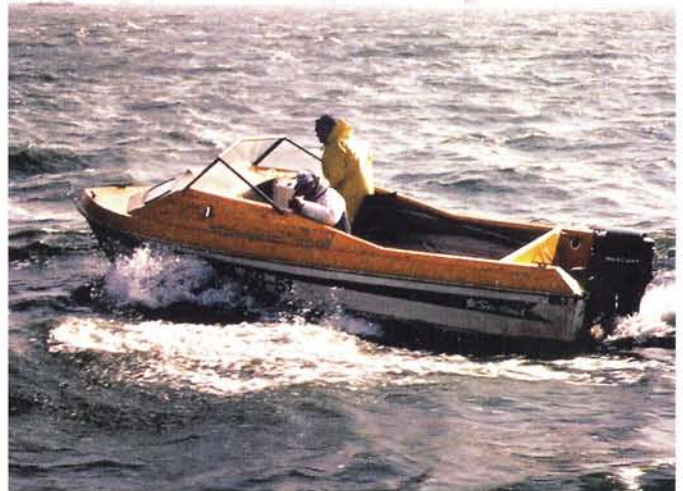
Wim de Bruijn en Theo Kampa aan het werk in de redactieboot.

Ook komen we hem en zijn kompaan, schrijver en fotograaf Theo Kampa, nog geregeld op het water tegen terwijl ze in de redactieboot opnames maken.