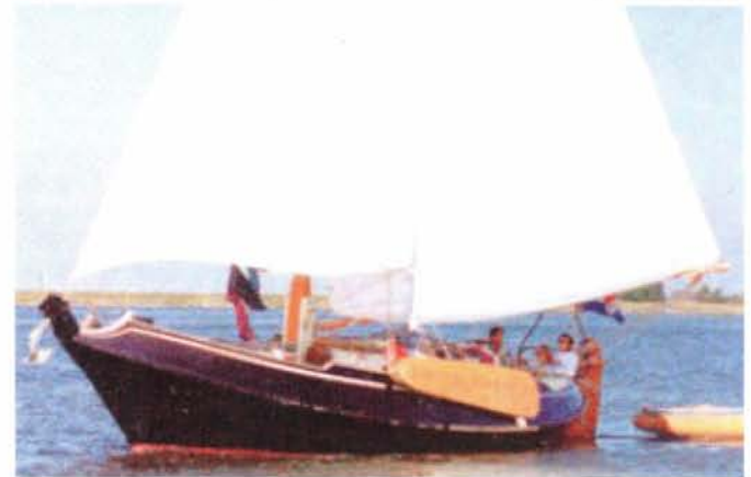
Wim de Bruijns zelf afgebouwde schokker Pieterrella .

Tegenwoordig zeilt Wim, nu de kinderen het huis uit zijn, geregeld