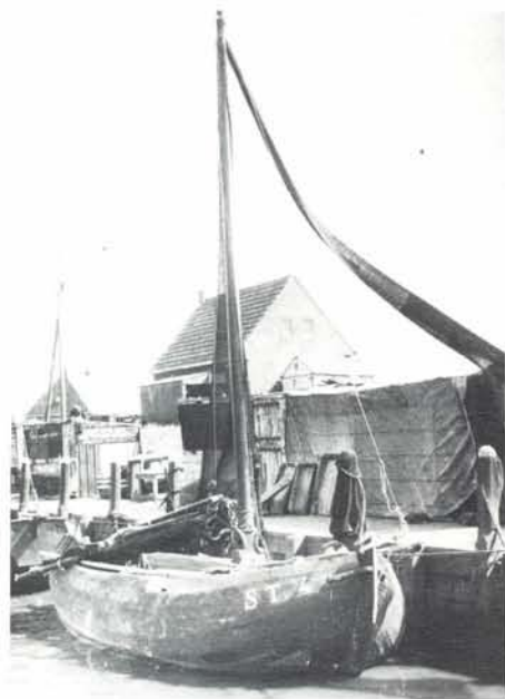
Staverve jol in de thuishaven.

„De voorgeschreven visserij zal alleen mogen uitgeoefend worden met kielschepen, die razeilen voeren, en die buiten en behalven de haringvleet, twintig lasten haringtonnen van veertien per last, onder de luiken kunnen bergen, en bemand zijn met tenminste dertien koppen.”