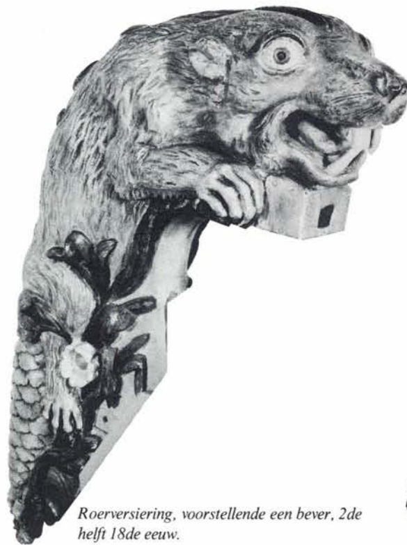
Roerversiering, voorstellende een bever, 2de helft 18de eeuw.