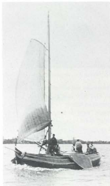
De Bever, fok te loevert, ca. 1890.