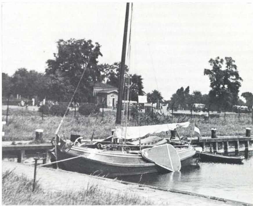
De Tornado II in de Sixhaven te Amsterdam, 1936.