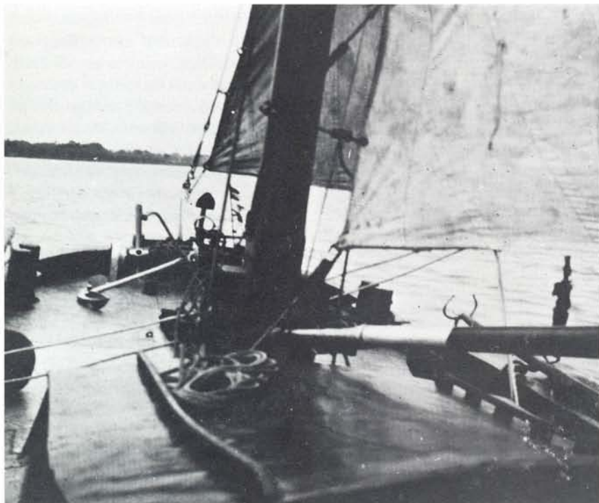
De Tornado II onder zeil, ca. 1936.