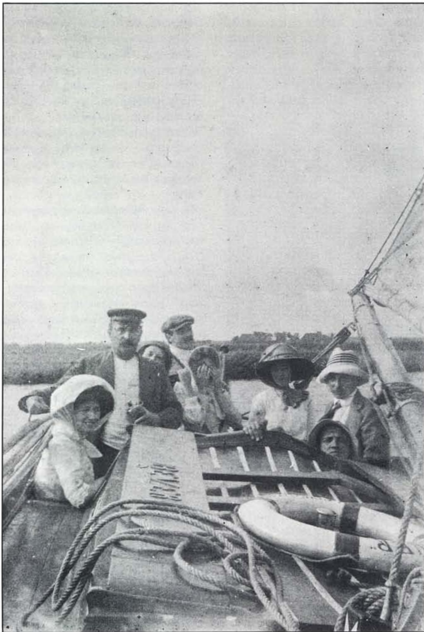
De familie Kalt en genodigden in de bollenstal.

maal water wat erin zat. Toen zijn we stude naar Sybesloot gegaan, zijn aan wal gegaan en hebben de boel eerst klaar gemaakt, want de boegdelling voor in de kajuit stond onder water . . . zoveel water hadden we erin gekregen. Toen ben ik aan het pompen gegaan en zij hebben wat water eruit geschept. Toen de boel klaar was heb ik drie reven gestoken en een stormfok en zijn we stude naar de overkant van de Meer gegaan, maar toen was de jonge heer zo benauwd geworden dat hij de boel niet meer vast durfde te zetten. Ik ben naar achteren gegaan, heb