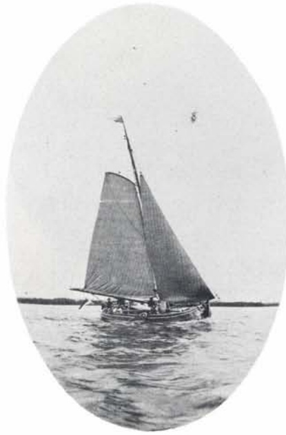
De Bever met gereefde zeilen, 1919.

Leden van de families Pijterssen en Wouda aan boord van de Bever, ca. 1890.