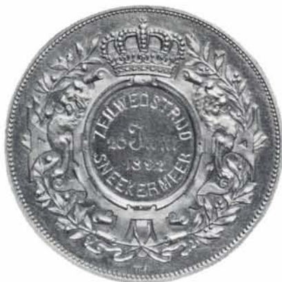
Gouden medaille ca. 4 cm, gewonnen door de heer Yke Wouda in 1892.

Ofschoon de heer Wouda niets vermeldt over de ouderdom van het schip en ook niet het jaar noemt waarin zijn vader het schip van de familie Wouters overnam, moet hij toch niet onbekend zijn geweest met de ouderdom van de boeier. Dit blijkt uit een uit het einde van de jaren dertig daterend krantenknipsel, in het