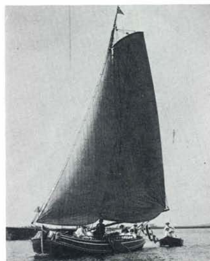
De Bever bij Grouw, 1915.