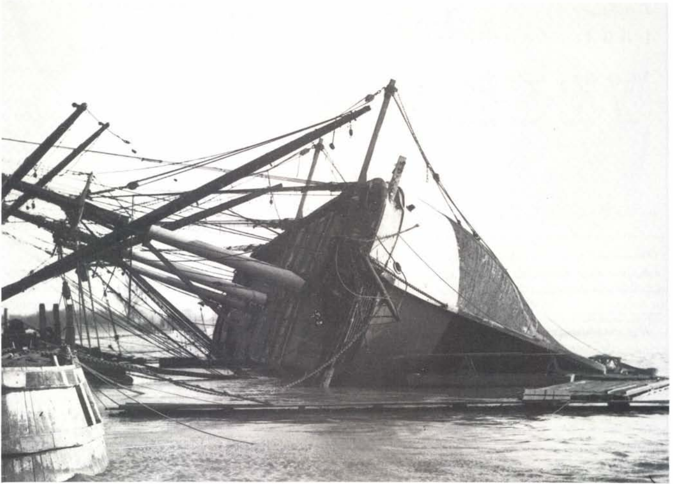
„Noach 4” gekrengd in Kr. a.d. Lek

liep enigszins gebogen, steeds gedekt met een hoge hoed, evenals al de scheepsmakers uit die tijd. Zijn gelaat had een strenge en gesloten uitdrukking als gevolg van zijn vast op elkaar gesloten lippen en ingevallen mond, terwijl zijn stekende ogen er een intelligente uitdrukking aan gaven. Hij was niet stug van aard, doch vriendelijk in de omgang.