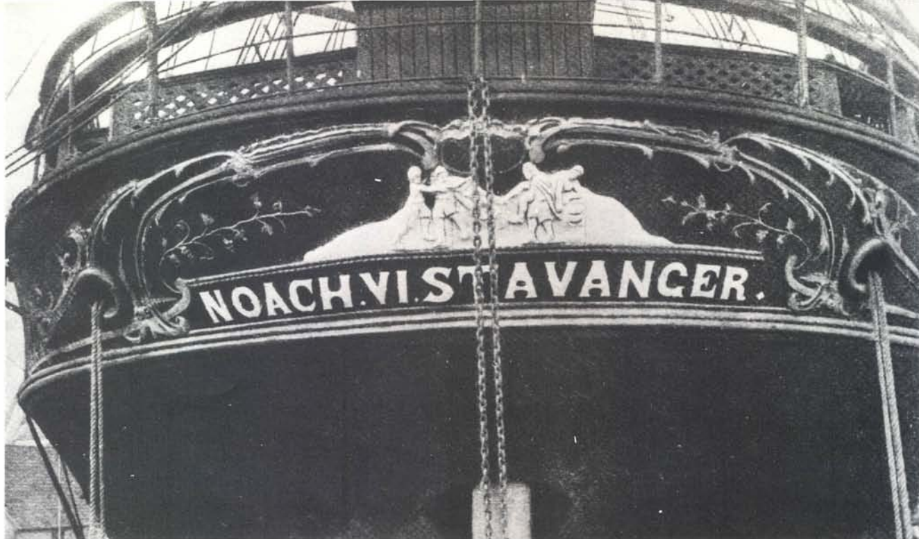
„Noach 6” Stavanger