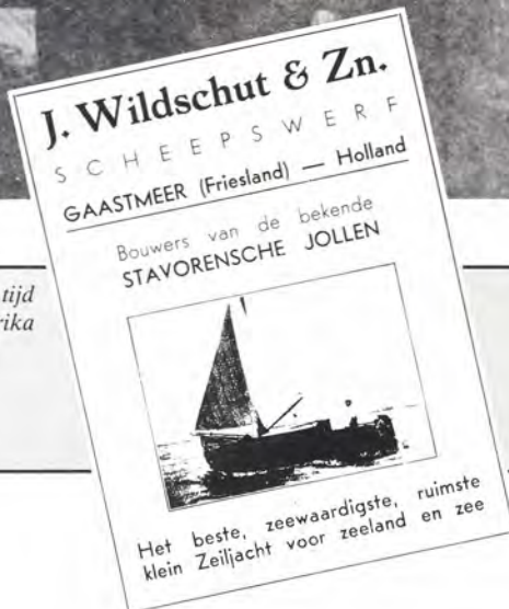
Advertentie in het Belgische watersportblad wandelaer sur l'eau (1934)