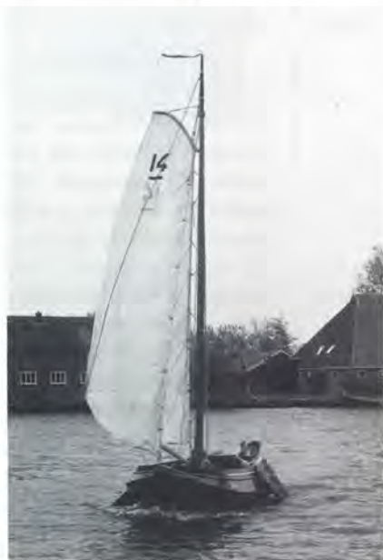
De joller de Brûzer