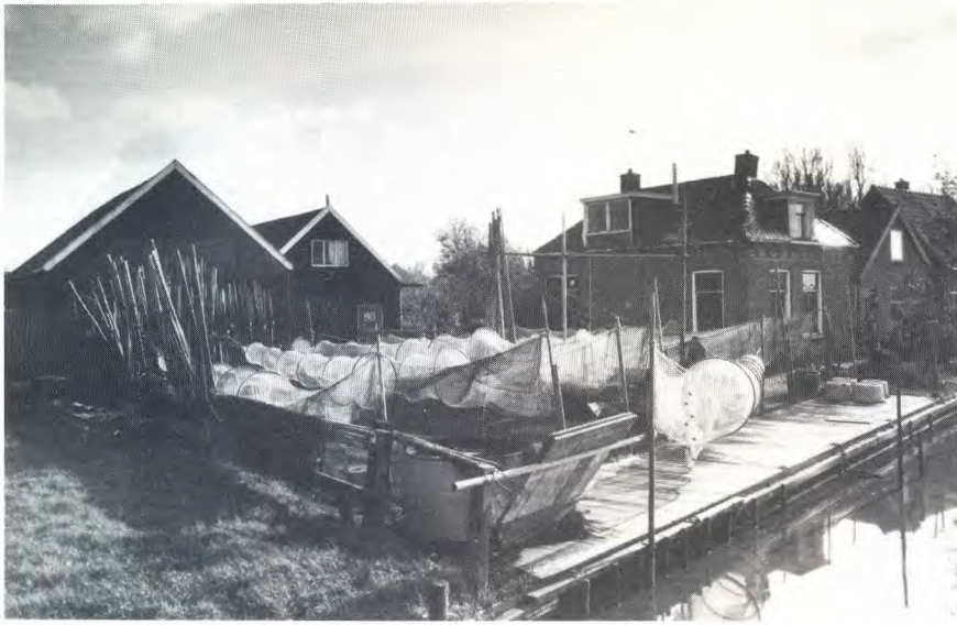
De voormalige scheepswerf anno 1987

te toen voor enige tijd op de werf. In 1893 trouwde Tjipke met Sjoukje van Dam en verhuisde met haar voor korte tijd naar Oudega. Zij was van een ander geloof, namelijk doopsgezind. Van de twee kinderen die zij kregen, overleed de jongste, Aukje, al na drie maanden. Tot overmaat van ramp stierf Sjoukje iets meer dan een jaar later. Deze ervaringen brachten Tjipke er toe om in het bevolkingsregister zijn godsdienst (Ned. Herv.) te laten doorhalen en daarboven te laten vermelden: geen. Kort daarna, in 1901, stierf Tjipke.