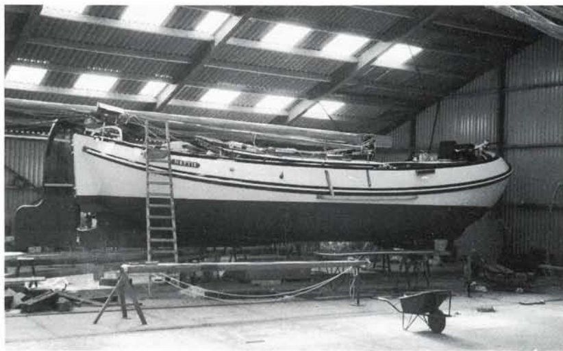
Foto pag. 7: De „Nettie" in de loods van Fa. Stofberg & Zn. in Enkhuizen.

«„Het zwaard blijft beneden, fokkeschoot vieren en beleggen." De „Nettie" schoot vooruit, op weg naar één van de barkassen. Ze hadden twee uur bijgelegd gelegen en hij had gezien hoe de gewichten weer uit het water werden gehesen. Naast hem hoorde hij de droge stem van de instructeur. „De volgende fase van de oefening is het bergen van de torpedo en nu mag jij eindelijk in actie komen. Jouw taak is het inpikken van de lijn van de kraan aan het wapen. Het komt vanzelf boven drijven." Hij zag de kleine spruitstukken. De stem naast hem: „De torpedo is beveiligd doordat er op de buis een koperen veiligheidsknop is geschroefd". Maar hij hoorde nog steeds de woorden „een schokmijn is een gevaar voor vriend en vijand". Zijn hart klopte in zijn keel. Langzaam voer de „Nettie" vooruit, de zeilen klapperden in de wind. Op zijn buik kroop hij over de lange klui-verboom. Hij greep de lijn van de kraan. Hij merkte dat zijn handen nat waren. Het schip dreef precies met zijn klui-verboom boven het gevaar. Snel liet hij zich over de klui-verboom zakken. Een moment dacht hij zijn evenwicht te verliezen en het water in de glijden, maar zijn voeten kregen weer grip op het rondhout. Snel maakte hij de snapschakel vast. Toen hij opkeek, zag hij de soldaten op de barkas, hun zwarte kwartiermutsen staken scherp af tegen hun witte gezichten. Eén van hen stak zijn duim op. Hij hoorde onder zich het snelle geruis van het boegwater.»