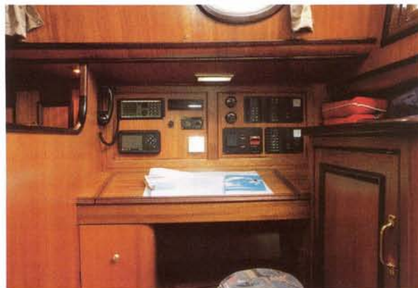
Een goed uitgevoerde navigatiehoek. Rechts de oliegoedkast.