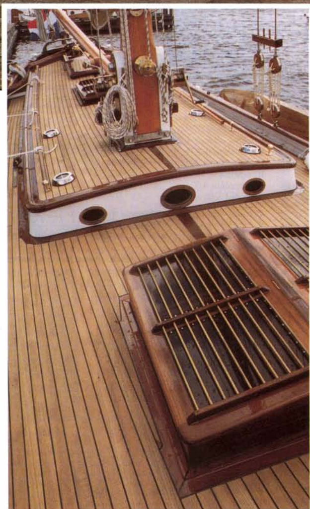
Teakhouten dekken, ruime gangboorden, LVJ lieren. Alles is even fraai afgewerkt.