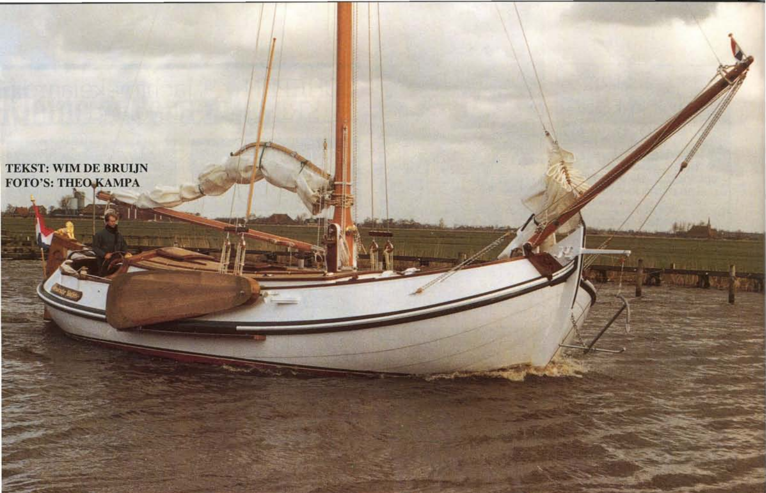
De „Hendrickje Stoffels” op de motor tijdens de proefvaart.