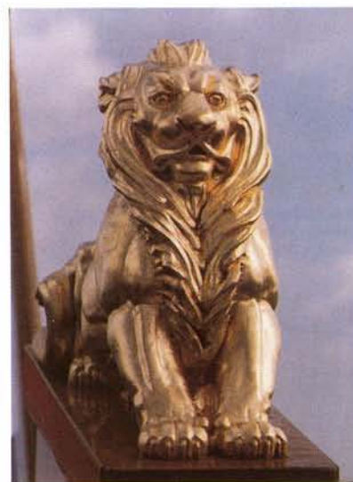
Een trotse leeuw houdt schipper en bemanning in de gaten vanaf het roer.