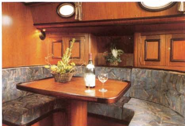
Detail van de zithoek. Let op de paneeldeurtjes voor de kastjes.

Afmetingen: 13,00 x 5,00 x 1,00 m Doorvaarthoogte: 27,50 m Zeilen: Grootzeil 56,5 m 2 , fok 34,88 m 2 , kluiver 20,41 m 2 Motor: Yanmar 100 pk diesel. Slaapplaatsen: 8 (4 hutten met elk 2 eenpersoons bedden) 2 douches, toiletten en wastafels met warm en koud stromend water. Hete-lichtverwarming, 100 l koelkast. Navigatiehoek: dieptemeter, log, GPS, marifoon Voor informatie over de verhuur, nieuwe en gebruikte ronde en platbodemjachten: Heech by de Mar b.v., De Draei 37, 8621 CA Heeg. Tel. 05154-42750, fax 43502.