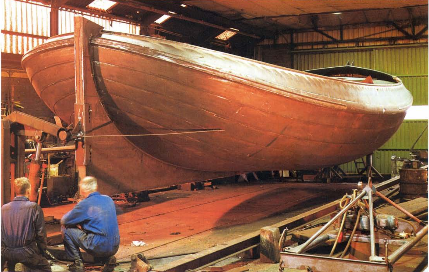
Het draaien van het casco van een 16,25 m Lemmeraak bij Blom in Hindeloopen.