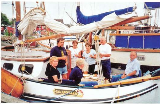
Het partyschip in functie. N.B. Het mooie (en erg dure) bordje met haar naam heeft de huidige eigenaar van onze oude boot gemaakt. Onze volgende boot gaat lb heten, omdat daar niet zo veel letters in zitten.