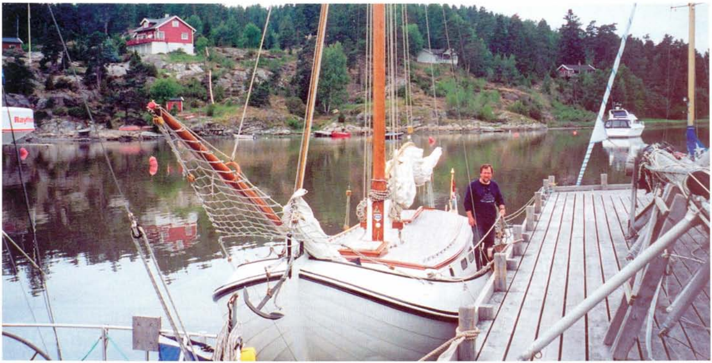
Het is overweldigend mooi bij de Noorse scherenkust: houten huisjes, vriendelijke mensen, verkoop van lekkere vis en dure alcohol.

en een driearmige kandelaar aan prijzen won. Het schip heeft Zweden bevaren, waar men zelden zo'n schip zag en natuurlijk de hele Deense kust en Bornholm.