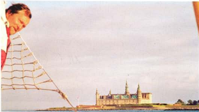
In Helsingør bij de Sont het beroemde slot van Hamlet, Kronborg, aan bakboord.