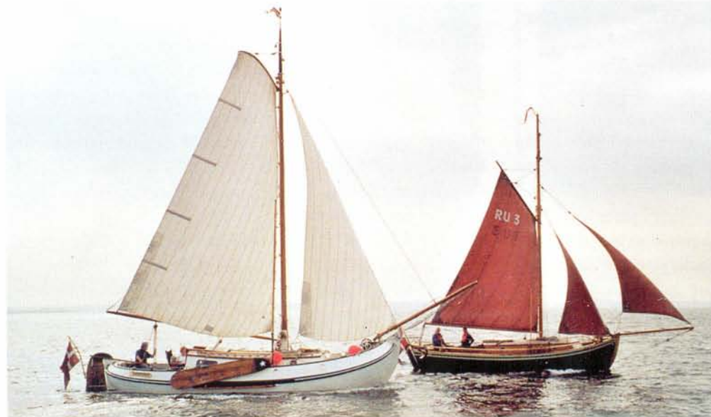
De Enhoorn en haar voorganger, het haringjacht Nagelfar , naast elkaar in het vaarwater ten zuiden van Fünen. Zelfs uit de verte kun je makkelijk zien dat de schippersvrouw dubbel zo veel ruimte en comfort heeft gekregen.

Welnu, wij lieten ons door niets afschrikken, ondanks welgemeende pogingen van de Nederlandse scheepsmakelaars. Toen het voor-