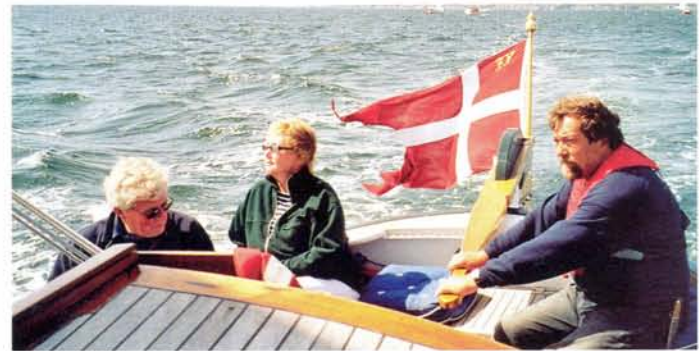
Hier suizen wij weg met 7 knopen. Als gewoonlijk hebben wij gasten aan boord; er is immers plaats genoeg voor iedereen.

Nu naderen we de pensioengerechtigde leeftijd en de Eenhoom moet weer eens terug naar de wateren van haar jeugd. Wie weet, misschien is er een Nederlandse zeiler die er over denkt haar hier over te nemen en haar in haar eigen spoor weer terug te varen na eerst zelf de Deense fjorden en belten aangedaan te hebben.