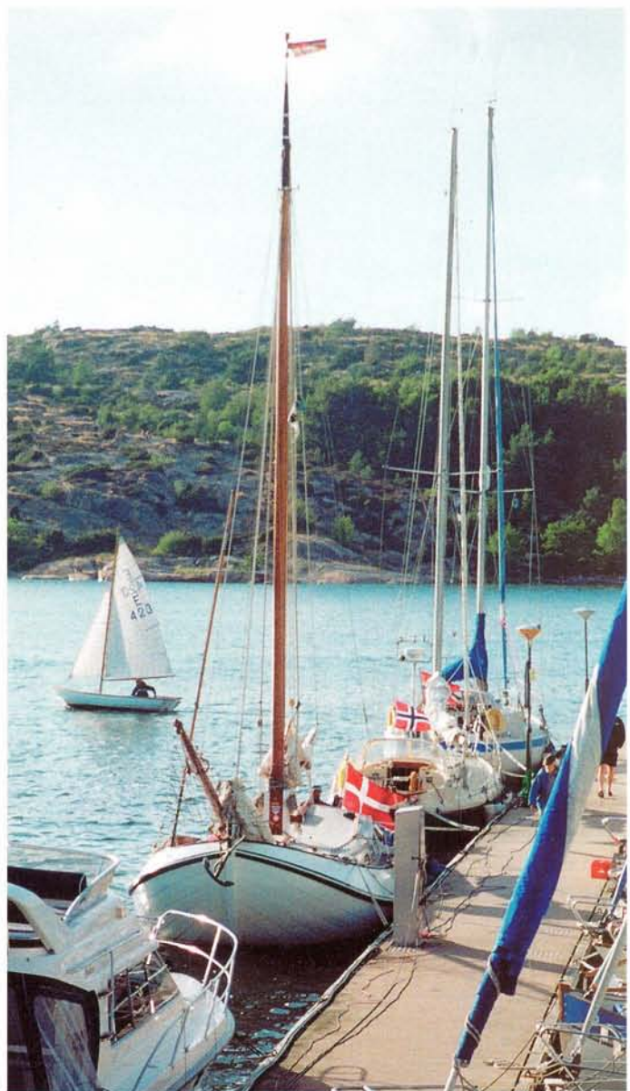
Samen met Noorse jachten het Oslofjord bevaren. "Hoe hebben jullie die badkuip over het Skagerak gekregen?"

jaar werd, lieten wij het prachtige schip met behulp van vrienden die verstand hadden van boten en motoren, te water. Het leek er langzamerhand voor ons op dat wij nog lang niet uit de kosten waren. Er ontbrak namelijk nog het een en ander. Wij moesten nog hebben: een gecombineerde maststrijkinstallatie, een ankerspil, nieuwe motorsteunen, 200 kg lood in het voorschip, nieuwe roestvrije zwaardlopers en zwaardophangmateriaal, een giek van teakhout en zo meer.