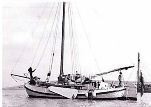
De Chantecler voor anker.