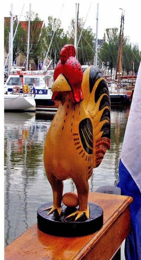
Het fraaie roerbeeld van de Chantecler .