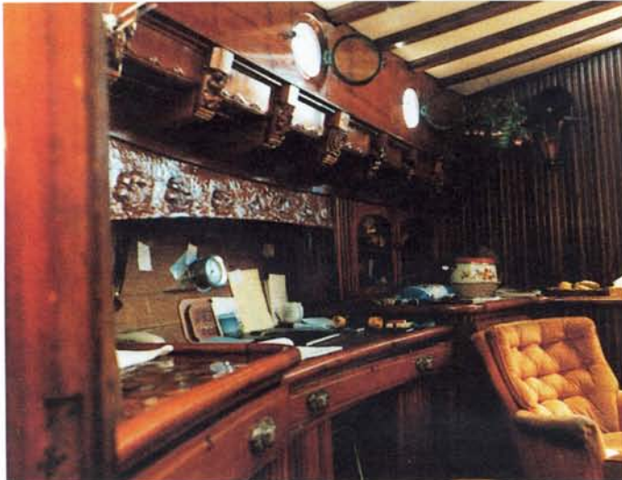
Let op de beeldhouwde kopjes van de dekbalken. Een fauteuil was in 1945 al normaal in een dergelijk ship.