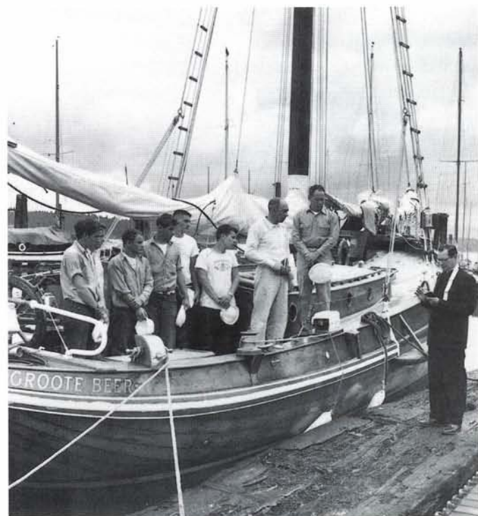
De fotocollage op pag. 10 is overgenomen uit het tijdschrift Rudder van October 1953. Helaas werd niet vermeld wie de foto's heeft gemaakt. E.e.a. geeft wel een goede indruk van de details.