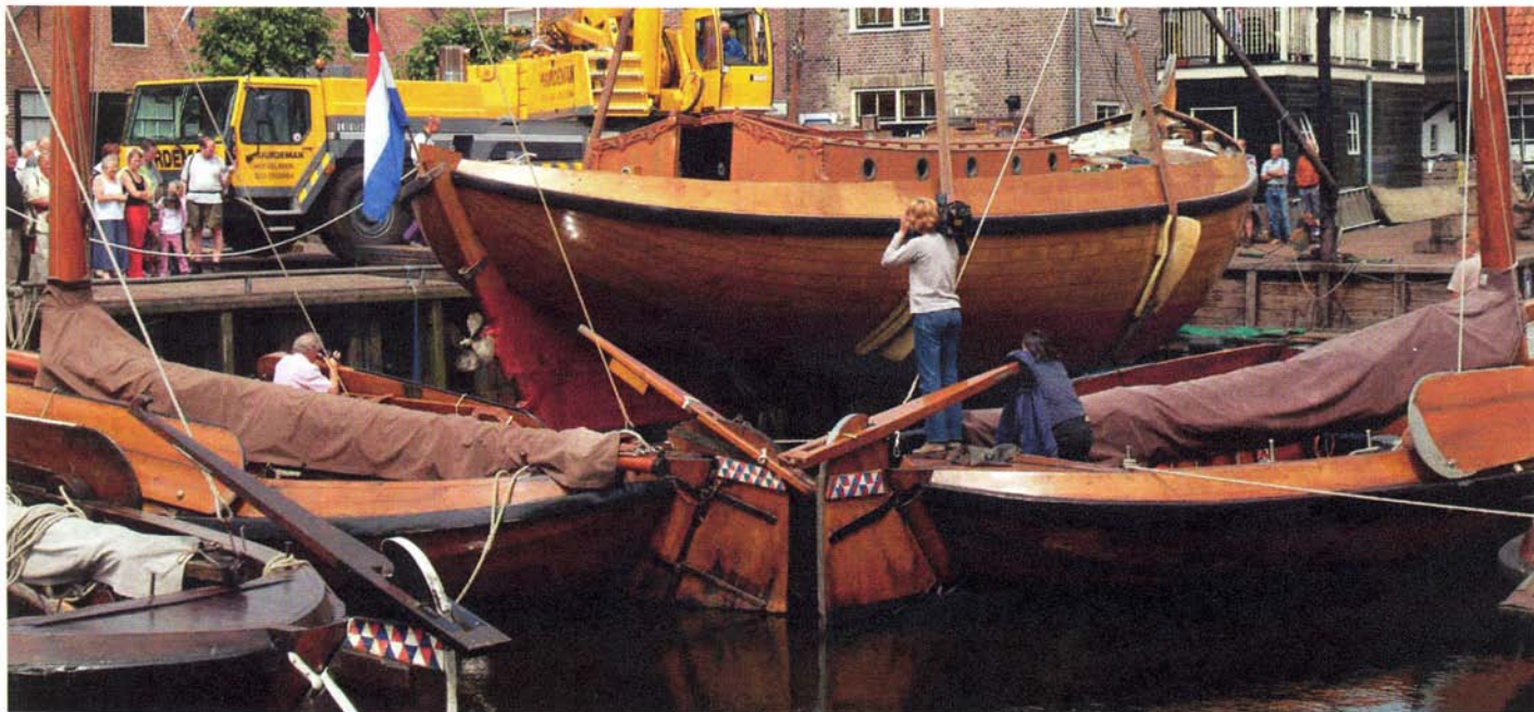
De tewaterlating op 5 juni bij Nieuwboer in Spakenburg. Een zware kraan zet het 38 ton zware schip in het water.

“But we will miss you, nevertheless, Groote Beer! ”