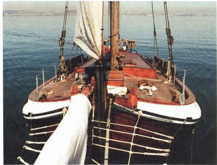
Jammer van het witgeschilderde boeisel.