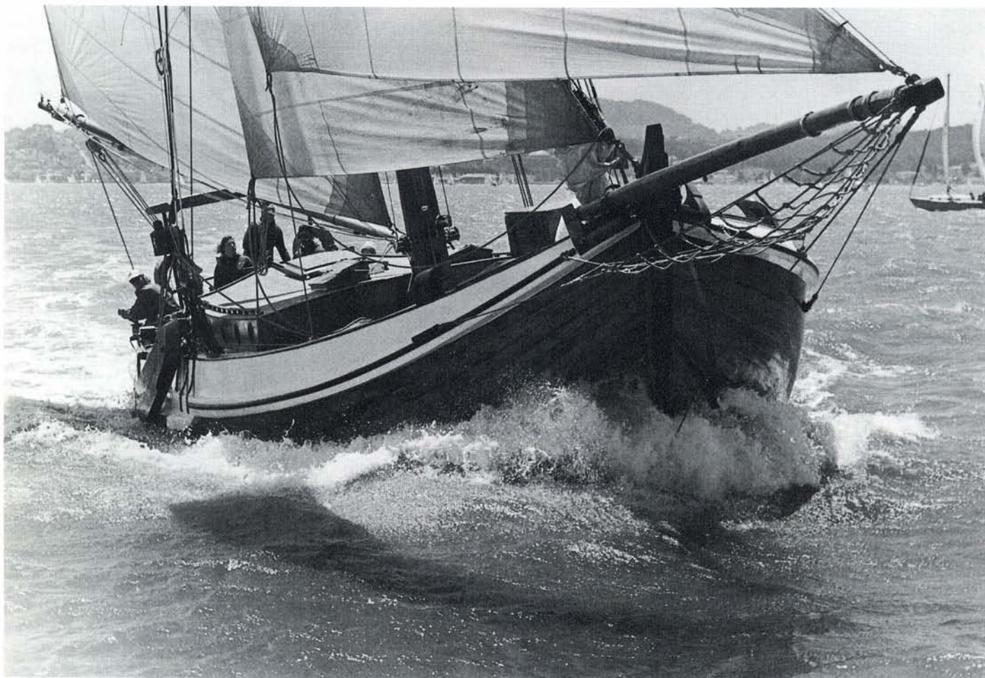
De Grooten Beer in de baai van San Francisco.