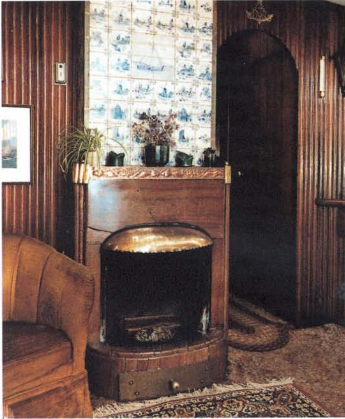
De open haard met originele tegels is nog in tact.