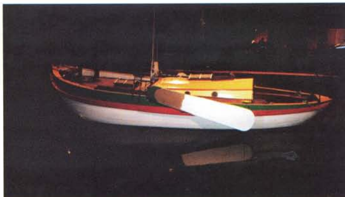
De Fides in het museum in Bordeaux.