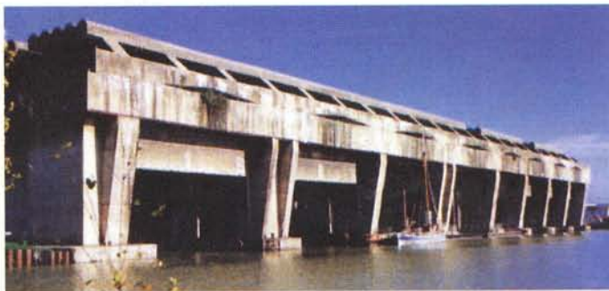
Betasom: La Base Souse Marin te Bordeaux.

Voor dit artikel heb ik weer contact gezocht met het museum. Helaas blijkt dat het museum geen lang leven was beschoren en het plezierjachten museum is weer gesloten, omdat de stad Bordeaux gaat investeren in een moderne tramlijn en de renovatie van de grote hangbrug en de historische panden langs de rivier. Het museum heeft reeds alle geleende spullen teruggegeven en heeft de Fides te koop aangeboden. Dus als er een lezer is geïnteresseerd in een botter uit 1938... Helaas zal er flink aan geschuurd moeten worden vanwege de bonte kleuren.