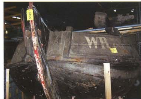
De WR 28, Twee Gebroeders in het Zuiderzeemuseum.