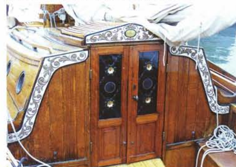
Het kajuitschot met deurtjes van de Eudia .