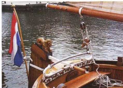
Het achterschip van de Eudia .