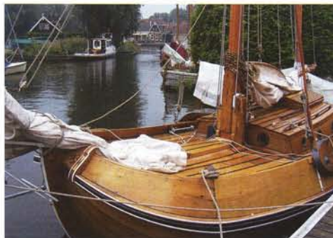
De Eudia na restauratie

Enkhuizen was Tholen's favoriete ligplaats. In