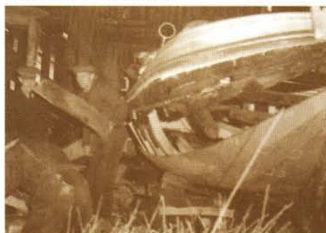
Restauratie van de Eudia in Joure omstreeks 1953. Onder: De Enkhuizer bol Eudia na restauratie.