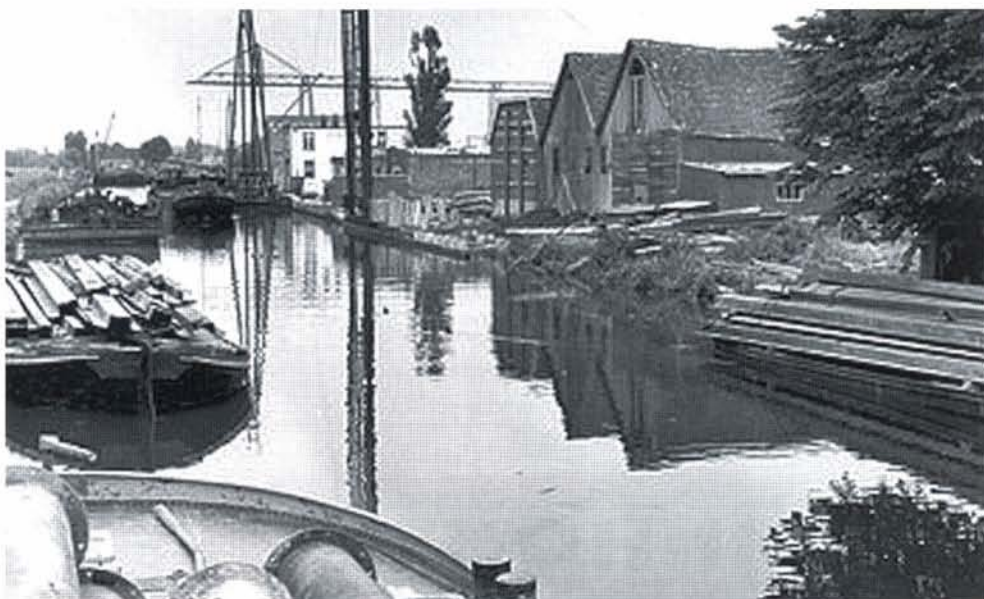
Vorbereidingen voor de aanleg van de Eebrug in de rondweg over de Dokkumer Ee, waarvoor de bebouwing langs het Blokkepad, (o.a. voormalige scheepswerf Krom en Regt, moet wijken in 1964.