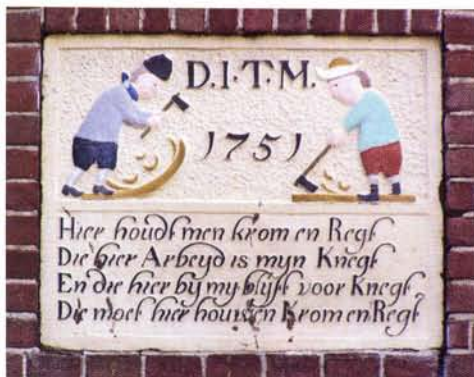
Gevelsteen met tekst 'Krom en Regt'.