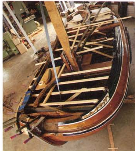
Het dek van de Roeland is verwijderd.

den aan tal van schepen kleinere reparaties en restauraties uitgevoerd.