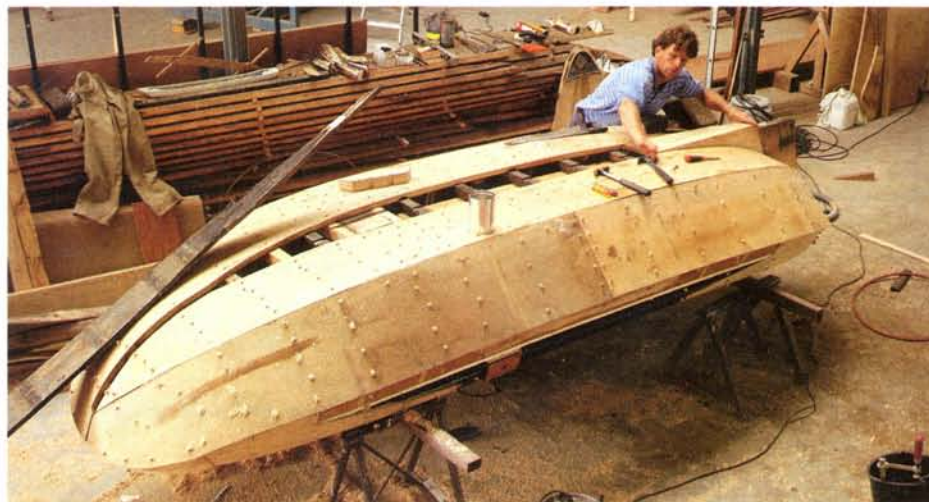
De tjotter Brûzer wordt helemaal gerestaureerd.

Als het zeilen met ronde jachtjes je met de paplepel is ingegeven, laat dat je kennelijk nooit meer los. Combert Burger is daar een goed voorbeeld van. Zijn moeder, wonende in Arnhem, bracht bij haar huwelijk een origineel Friesch boatsje - de Rûzer , gebouwd bij Hans Bijl in Oppenhuizen in 1898 - in. Zodoende was het spelenderwijs leren zeilen in deze eengangstjotter voor hem even gewoon als het leren lopen en fietsen. De Burgers gingen ook met deze tjotter (4,35 x 1,48 m) op vakantie, totdat het gezin te groot werd en er naar een grotere boot moest worden omgezien. Dit werd de tjotter Doomroosje . Thans beweren sommige mensen nog dat het niet toevallig is dat Combert negen maanden na zo'n vakantie met de Rûzer is geboren. Na aankoop van een zomerhuisje in Giethoorn wordt het vaargebied voor de familie voornamelijk de kop van Overijssel en Friesland. De Doomroosje wordt uiteindelijk ingeruild voor het Friesche jacht De Oude Liefde .