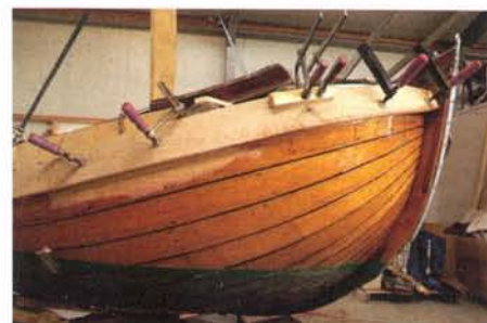
De kop van de Roeland , een Fries jacht gebouwd in 1918, het nieuwe boeïsel wordt aangebracht.