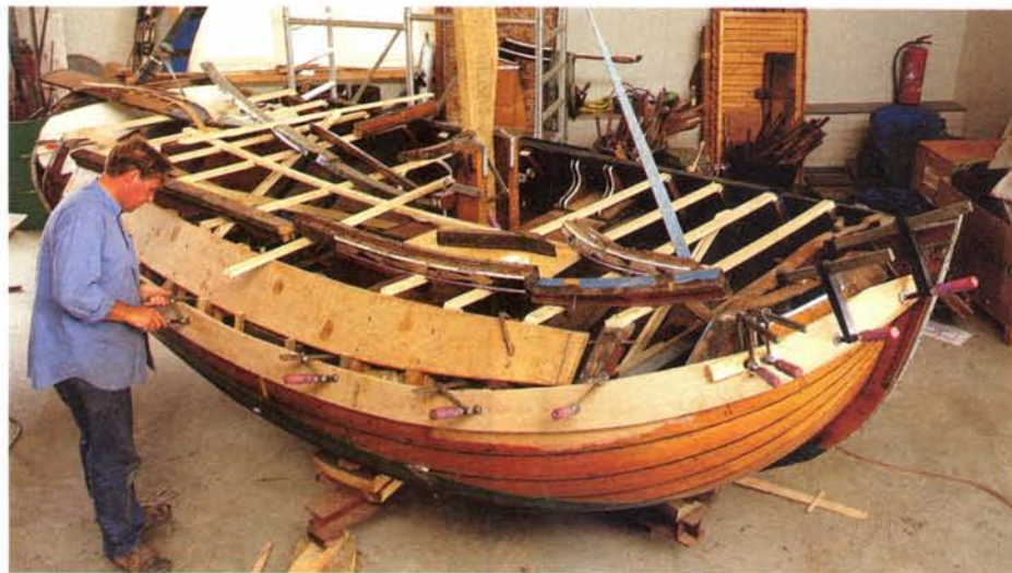
Een nieuw boeïsel aanbrengen is geen eenvoudige klus.

vaer als een totaalrestauratie kan worden gezien. Eén legger, het oude beslag, de roerklik en als belangrijkste aspect de (originele) karakteristieke vorm van het schip zijn behouden gebleven. Ook andere type schepen is hij niet uit de weg gegaan. Zo timmerde hij het De Vries Lentsch-jacht de Nenuphar (een Colin Archer-achtige kotter) geheel opnieuw in en recentelijk de klipper De Verwachting . Daarnaast wor-