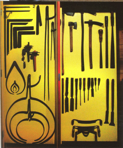
Op een vijftal panelen zijn de historische gereedschappen soort bij soort tentoon gesteld.