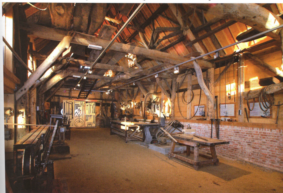
Onder: De geheel gerestaureerde zaagloods. Links het aandrijfmechanisme voor de hellingier.