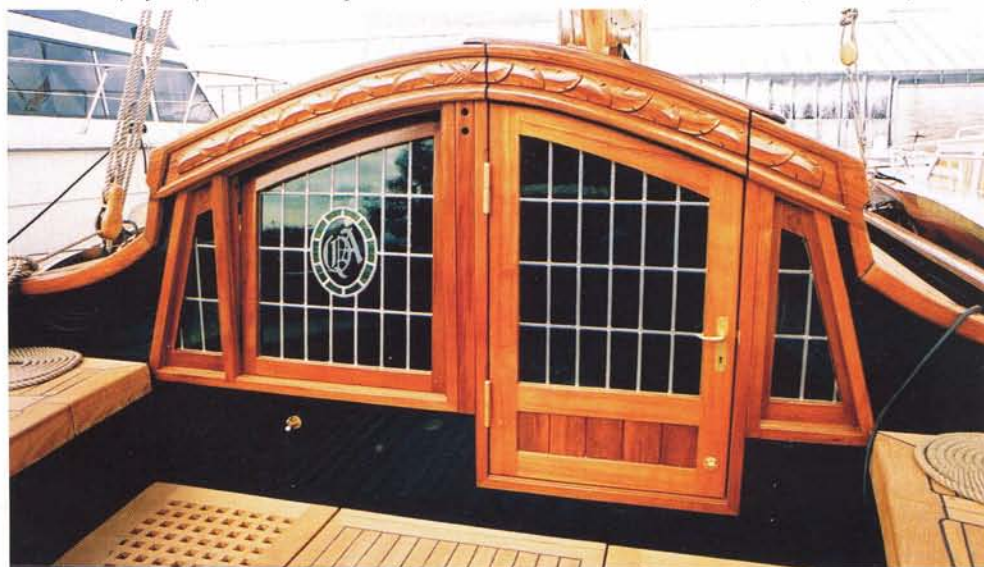
Foto onder: Kajuitfries op de Brandende Liefde van de verhuurvloot van Heech bij de Mar. Let op de symmetrie.