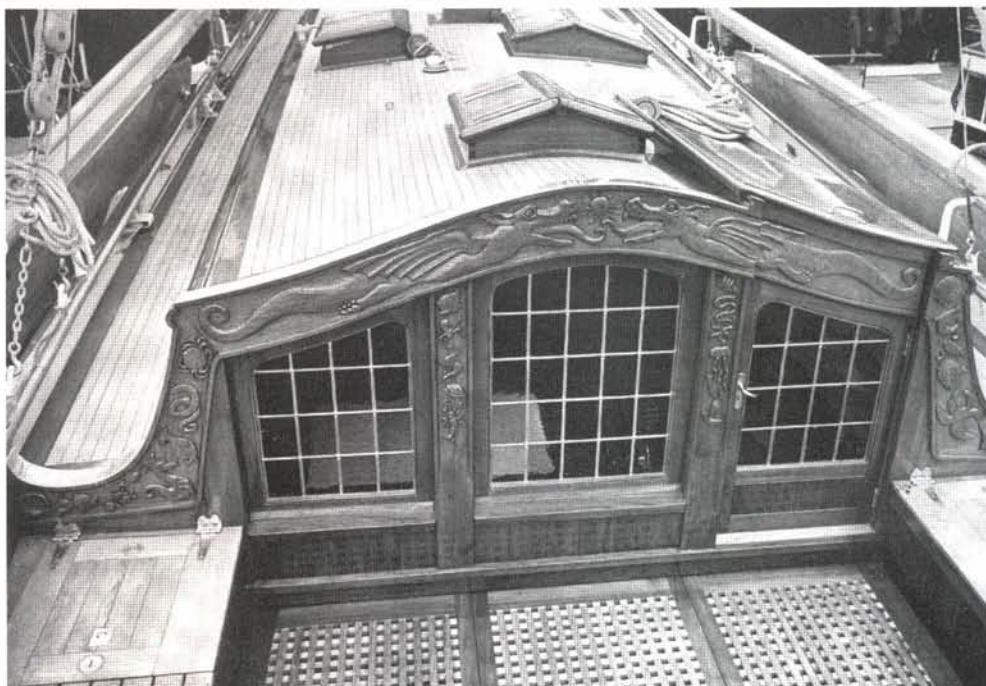
Het achterschot van de kajuit van De Groene Draeck. Het ontwerp van de kajuitfries is van Koningin Beatrix zelf.