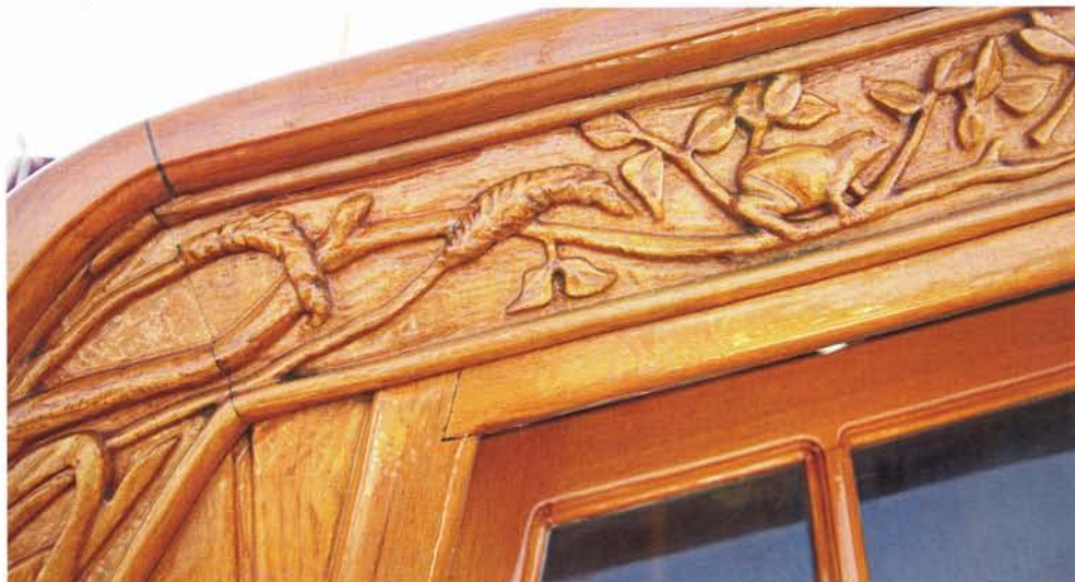
Detail van een door Reudenroos ontworpen en uitgevoerde kajuitfries.