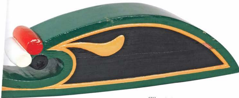
"Klaver" of takje ? Scheepvaartmuseum Sneek, 1983 003.

Tegenwoordig zie je een veel grotere verscheidenheid aan afbeeldingen zoals zeilende bootjes, een kreeft, een zeehond, een ondergaande zon, noem het maar op. Alles wat je maar kunst verzinnen in relatie tot de naam van het schip. Heel jammer vind ik dat de contourvormen van de tegenwoordige klikken zo eenzijdig gekozen worden. Zoals ik al eerder schreef, is de contourvorm ook een herkenningsteken van de maker of van de streek van herkomst. Juist die kleine verschillen maken het zo leuk. Ga bijvoorbeeld eens kijken in het Scheepvaartmuseum te Sneek naar de vele verschillende uitvoeringen en klikvormen.