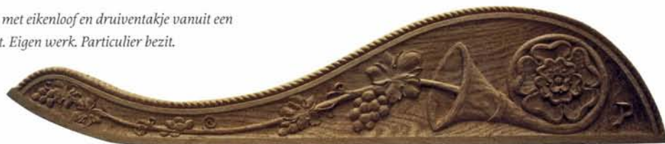
Klik met eikenloof en druiventakje vanuit een rozet. Eigen werk. Particulier bezit.

uit deze drie tonnetjes ontspruit dit takje. In de combinatie van de drie tonnetjes (ook wel het klaver genoemd) met dit takje zou je een klavertje kunnen herkennen in het zij-aanzicht. In de grafische kunst van de Kelten kom je dit ornament vaak tegen. Maar de natuurgetrouwe wijze waarop de drie tonnetjes gesneden werden, compleet met de ijzeren banden, sluit dit volgens mij uit. Wat dit takje of blaadje dan wel voorstelt is mij nog niet duidelijk geworden. Waarom zou je al die moeite doen om de twee zijkanten van een klik terug te snijden om er vervolgens niets meer te laten staan dan een friemeltje? Wie het weet mag het zeggen.