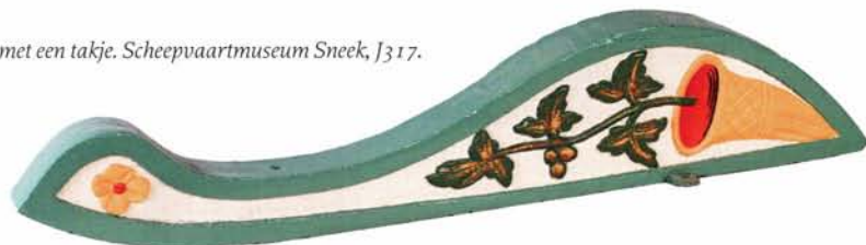
De hoorn met een takje. Scheepvaartmuseum Sneek, J317.

Een meer voorkomende afbeelding is natuurlijk de hoorn des overvloeds waar een takje uitkomt. Deze afbeelding wordt soms uitgelegd als een levensboom of als Heimdall's hoorn; een oud Noors symbool, waar uit de hoorn van Heimdall een levensboom groeit. Dat zou een mogelijke verklaring kunnen zijn. Levensbomen komen in onze volkskunst overal en veelvuldig voor. Wat er niet voor spreekt is het feit dat onze "levensboom" horizontaal afgebeeld wordt. Dat is iets wat je niet verwacht bij een levensboom. En wat betreft Heimdall, de gelijkenis is treffend, maar ik vind het moeilijk om een oud Noorse sage zo vaak vertaald te zien op Hollandse klikken. De simpelste uitleg is, de naar rijkdom verwijzende