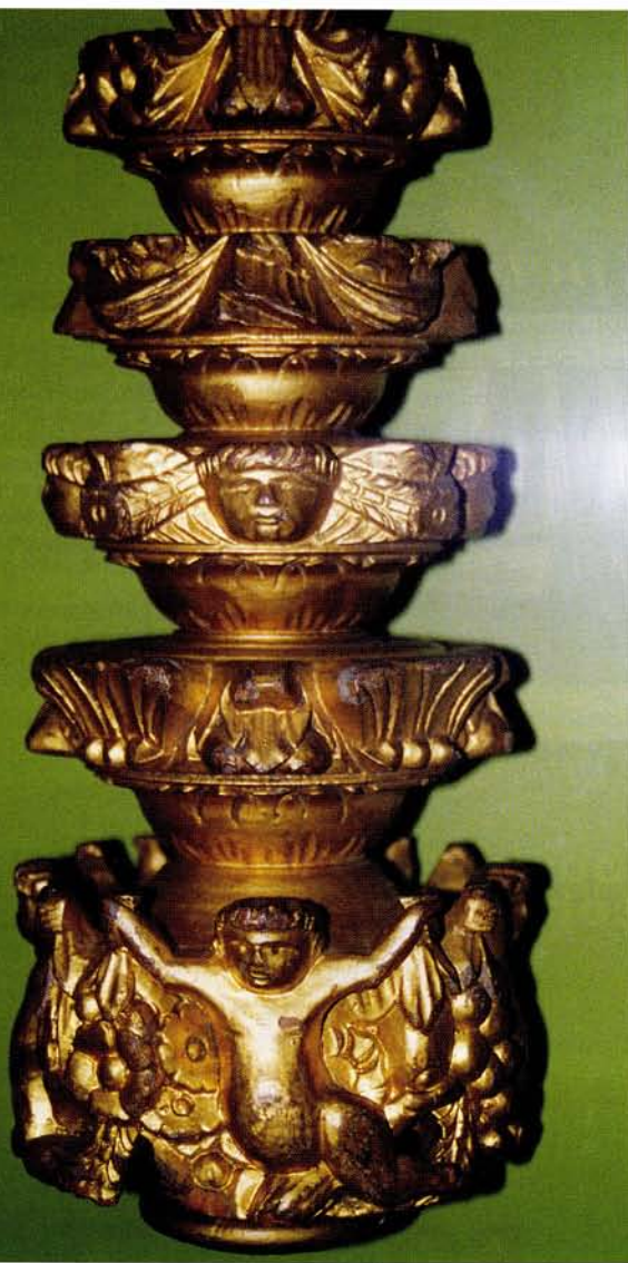
Onderste deel van een lange mastwortel met een lengte van 1,09 m van verguld hout uit 1750. Fries Scheepvaartmuseum, Sneek 2003-1016.

Allereerst zoek je een taai en fijnnervig stukje hout. Het liefst zo rechtdradig mogelijk. Van oudsher werden hiervoor lichte houtsoorten gebruikt. Ik heb wat onderzoek gedaan naar mastwortels uit Nederlandse musea en de top vier is wilgen, iepen, eiken en linden. Eiken is in dit verband een vreemde eend in de bijt, omdat eiken breekbaarder en zwaarder is dan de overige houtsoorten. Andere gebruikte houtsoorten zijn grenen, appel en cederhout.