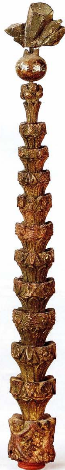
Korte mastwortel met bladbekroning. Fries Scheepvaartmuseum J 019.

Het maken van een mastwortel is een hele kunst. De meeste zijn gedraaid uit één lengte, hoewel samengestelde ook wel voorkomen, vooral bij grote lengtes of toegevoegde topbeëindigingen.