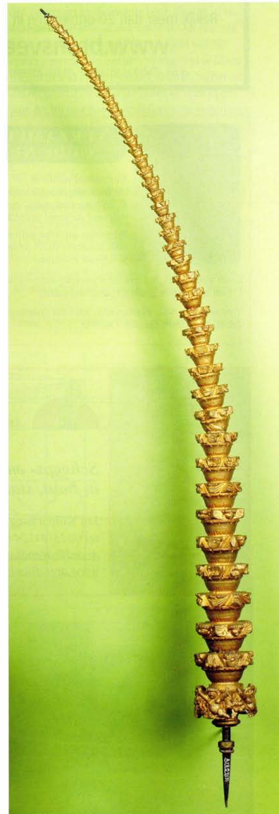
Lange kromme mastwortel. Nederlands Scheepvaartmuseum. A 1259(03)5.