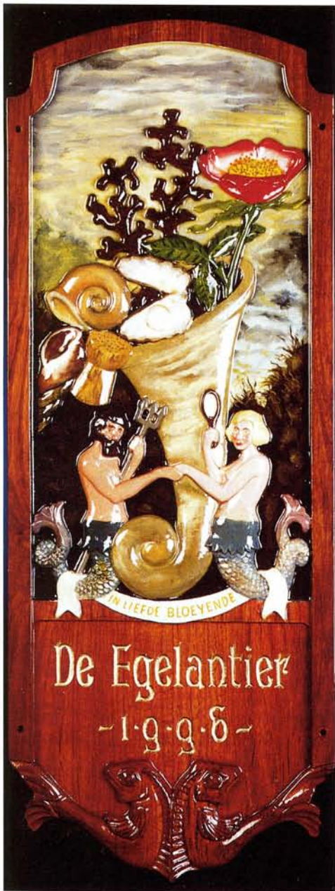
Mastplank op de Egelantier, als reclame-uiting voor het gelijknamige charterschip van M. Hoekstra (eigen werk).

het reeds gedaan met deze kleurrijke of van goud glanzende versieringen, die voor het merendeel nog slechts door pleziervaarders gehandhaafd worden. Zij verdwijnen snel, tezamen met het houten zeilschip, enz. Hij eindigt met de woorden: 'Het hart dat het oude mint, moge deze ontwikkeling betreuren; het dient te aanvaarden dat zij onontkoombaar is'.