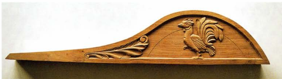
Klik Goudhaan. Symboliek van de haan is waakzaamheid en van de opkomende zon is hoop (particulier bezit, eigen werk).

"Juist dat wil ik u in de komende artikelen laten zien. Er zijn vele aspecten die wezenlijk veran-