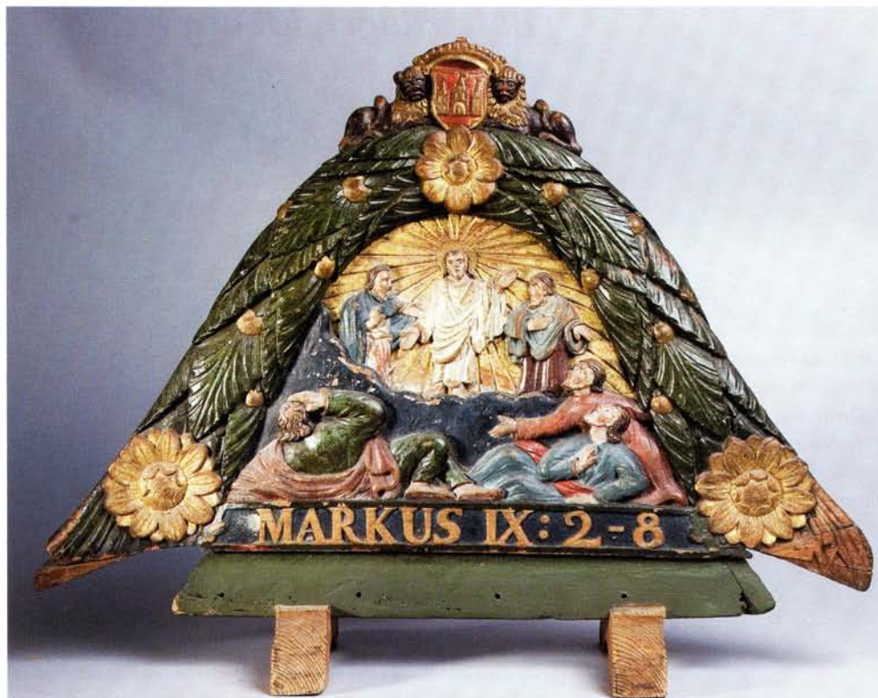
Hakkebord met uitbeelding van het geloof uit het Fries scheepvaartmuseum Sneek.

Ten vierde kan men door middel van vergulde krullen en tierlantijnen zijn rijkdom tonen. En als laatste is er gewoonweg de drang van de mens om alles te ornamenteren, te versieren. Alles waar je trots op bent, mag mooi zijn!", aldus Van Roden.