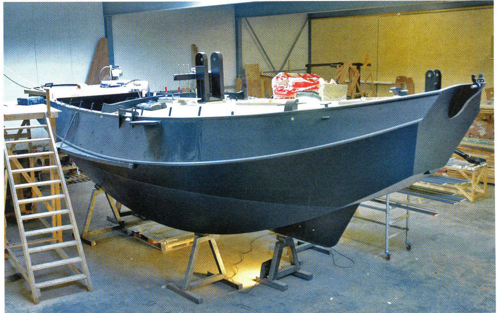
Een casco in de aftimmerloods.

We zien in de werkplaats ook een heel slimme lijmbank met een groot aantal hydraulische persjes. Zwaarden en roeren worden zonder pennen,