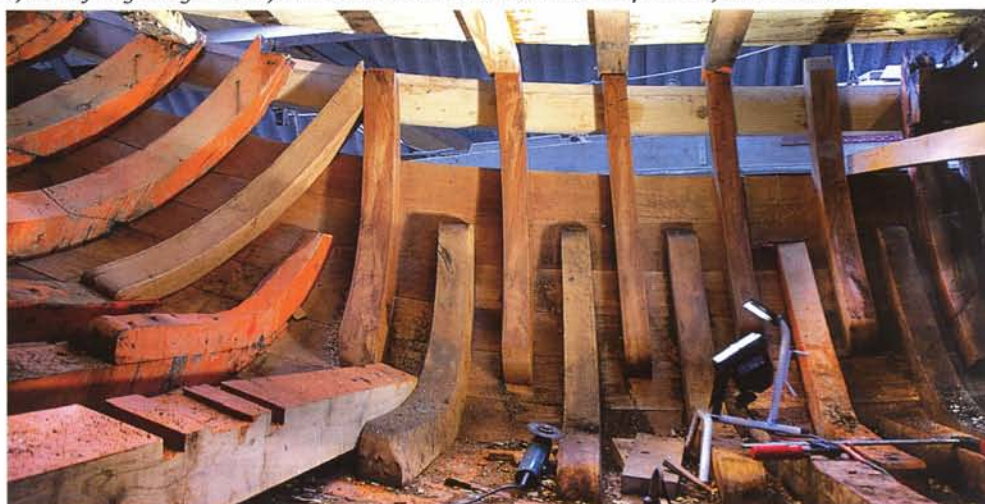
Een prachtig gezicht al de nieuwe inhouten, spanten, knieën, krommers en liggers.

Jan van Seumeren restaureerde jaren geleden ook al de loodsschoener Silver Spray (zie SdZ.1987.1 en 1999.2). Nu is hij de trotse eigenaar van het praktisch nieuwe botterjacht Fides . Hij kan alleen met het schip zeilen en op de motor varen, er is zelfs een boegschoef