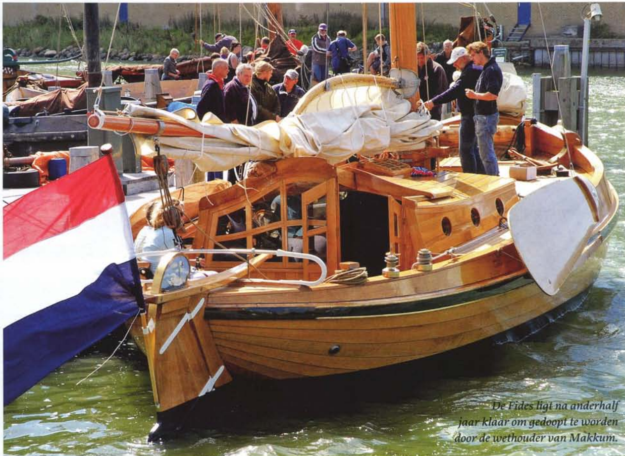
De Fides ligt na anderhalf jaar klaar om gedoopt te worden door de wethouder van Makkum.

Volgend seizoen komt zeker het vervolg als we interieur- en zeilfoto's kunnen publiceren. Maar zoals de Fides er nu bij ligt, is het al een plaatje! Een prachtige jachtbotter, met een prettige maat van 12,20 m over alles, een ide-