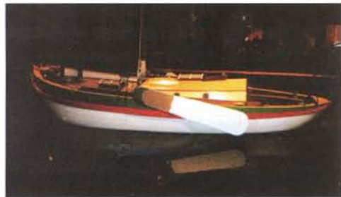
De Fides in het watersportmuseum in Bordeaux.

In dit artikel kunt u lezen hoe de Fides weer naar Nederland is gebracht en in augustus na een restauratie van anderhalf jaar, als nieuw te water is gelaten.