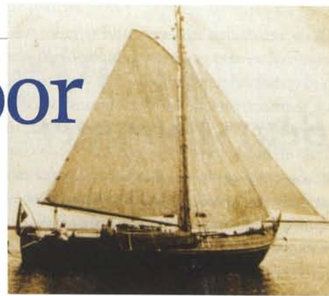
De botter Fides onder zeil ± 1950.

Pas in de zomer van 2004 kreeg hij een hoge vraagprijs door van de gemeente en dat geteld