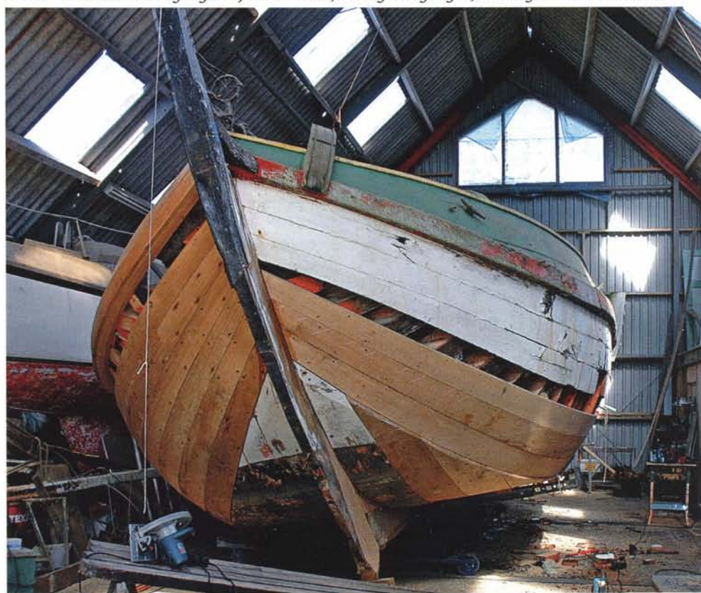
Onder: De onderste drie gangen zijn vernieuwd, nu nog vier gangen, het berghout en het boeisel.