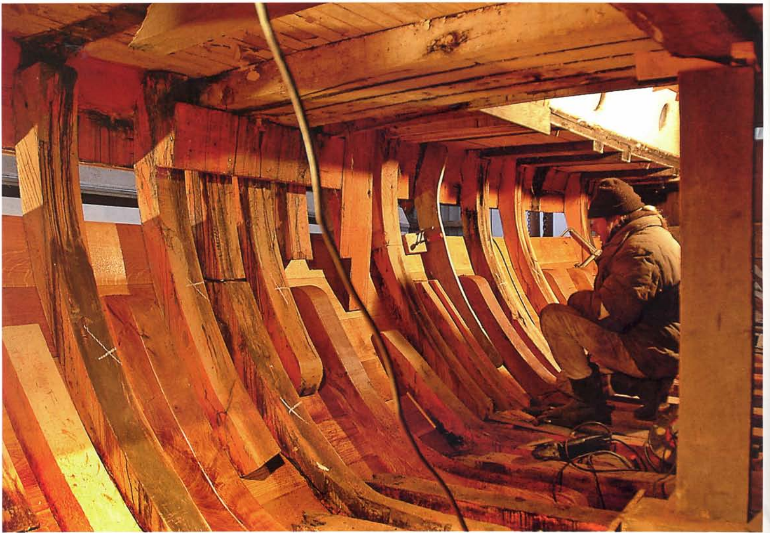
De jachtbotter is veel lichter gebouwd dan de oude vissersjibotters. Alle spanten, inhouten en liggers moeten worden vernieuwd, evenals het zeilwerk. Onder: Het achterschip aan stuurboord is al nieuw, evenals de achtersteven, nu nog de gangen aan bakboord.